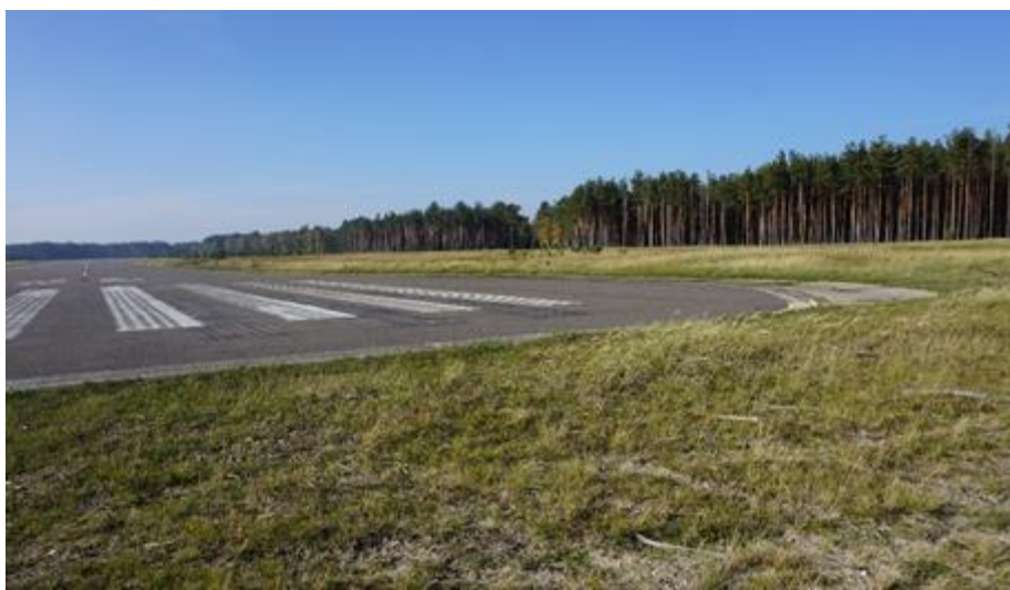
2018 metai, ruduo