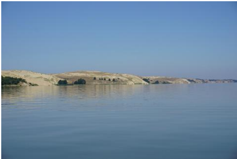
2015 metai, vasara