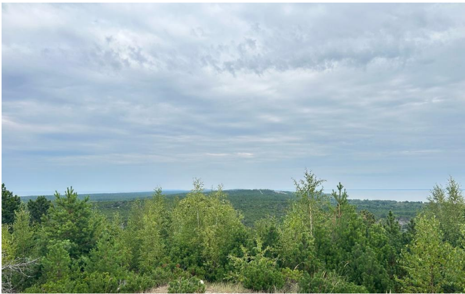
2023 metai, vasara