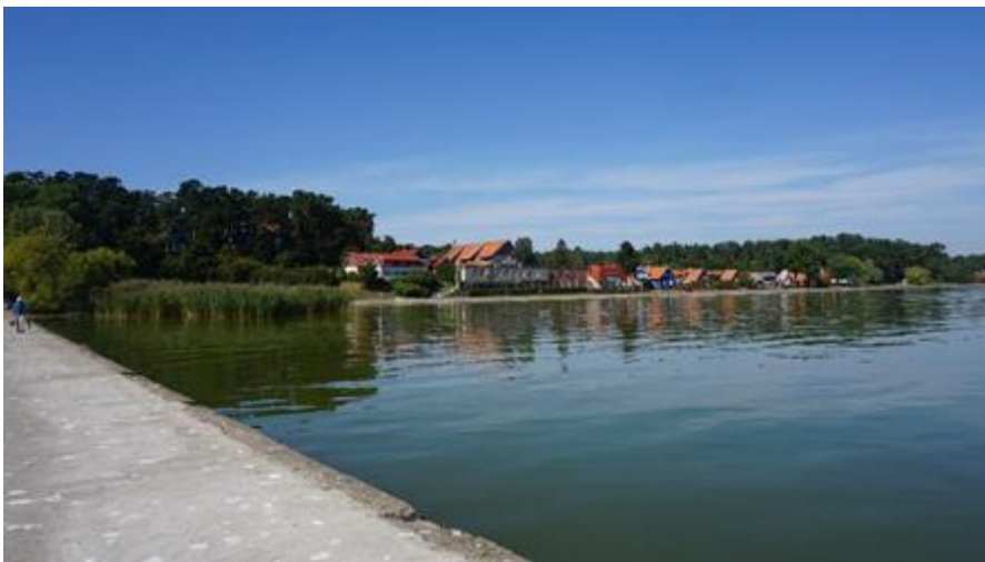
2019 metai, vasara