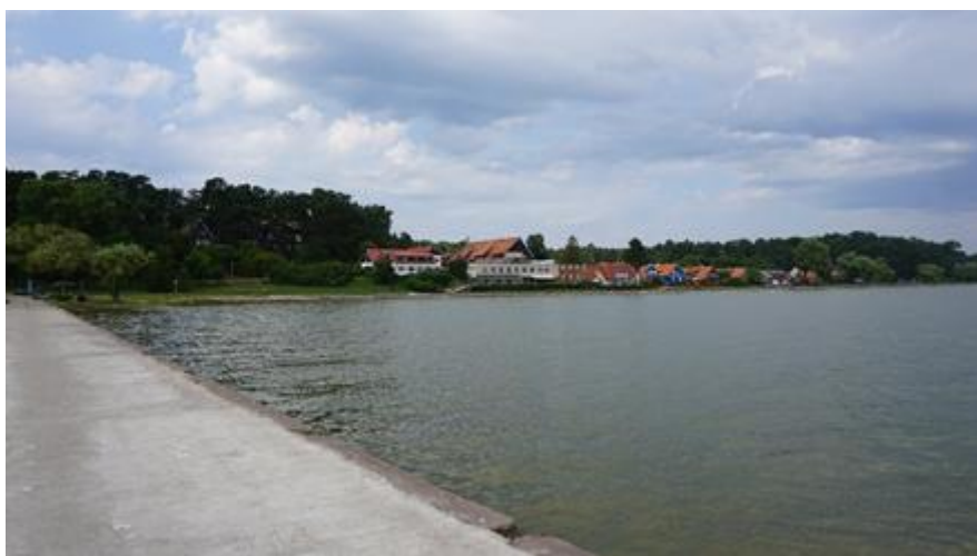
2021 metai, vasara