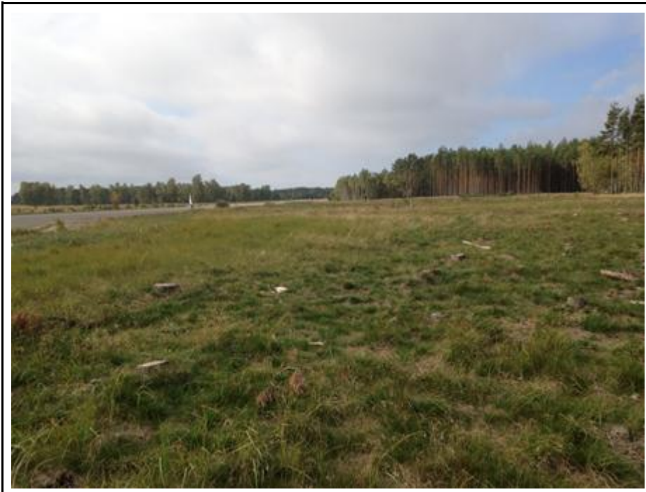
2014 metai, ruduo