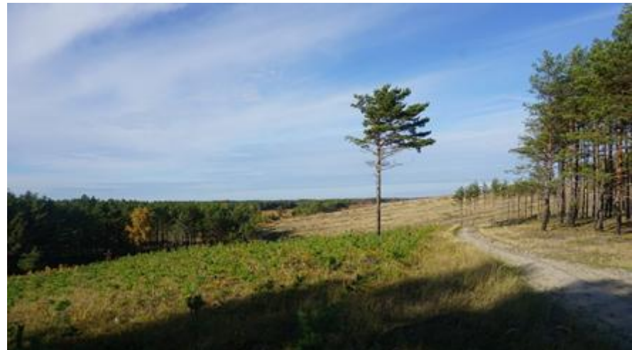
2019 metai, ruduo