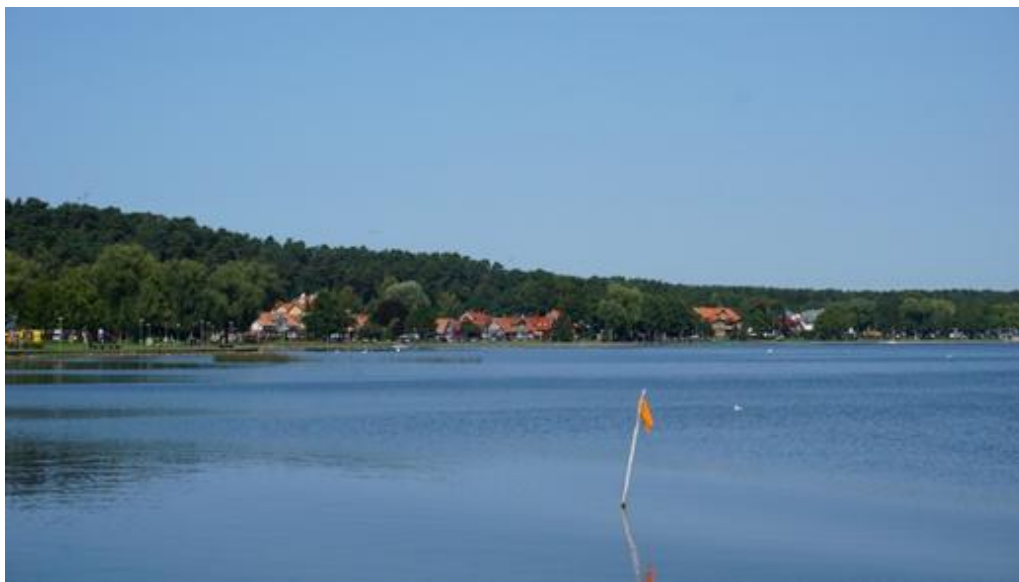
2020 metai, vasara