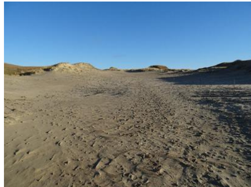
2016 metai, gruodis