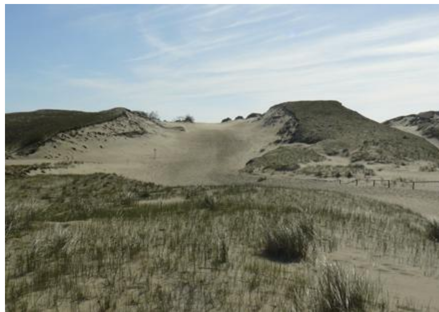
2011 metai, gegužē