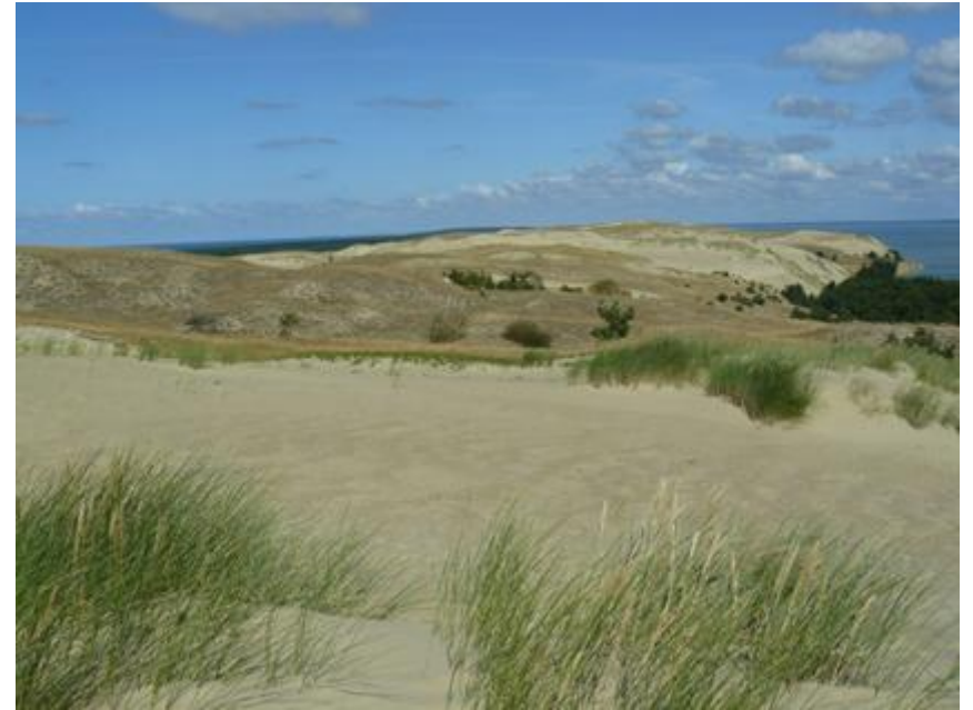
2009 metai, vasara