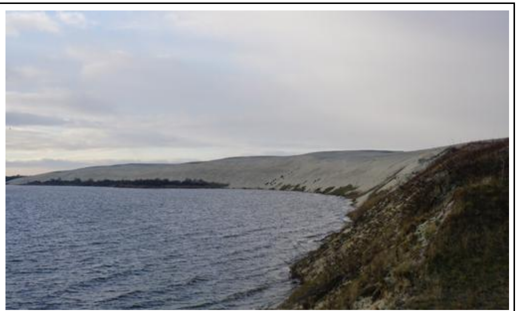
2016 metai, ruduo