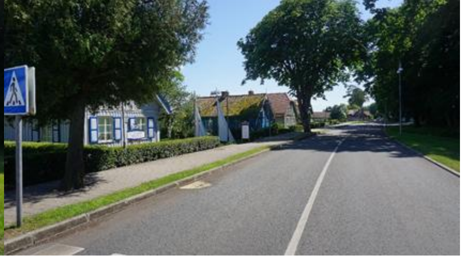
2020 m. Juodkrantės bažnyčia, vasara