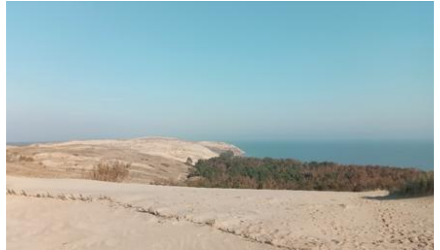
2018 metai, ruduo