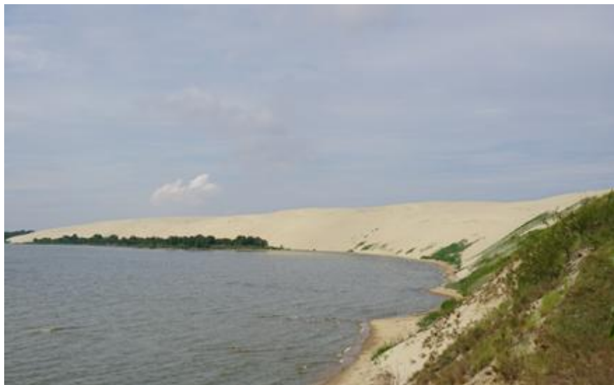
2017 metai, vasara