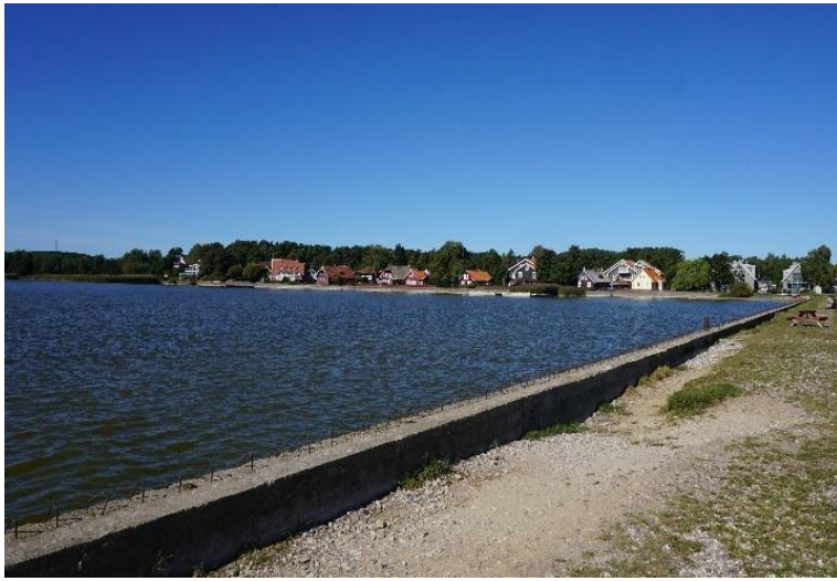
2022 metai, ruduo