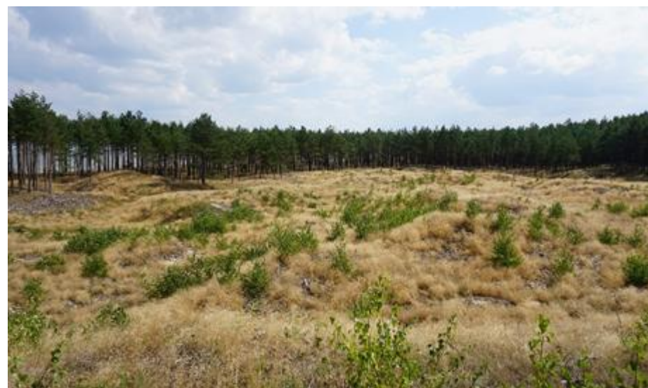
2018 metai, vasara