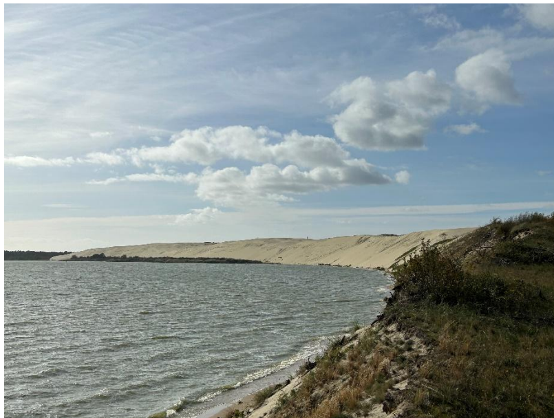
2023 metai, ruduo