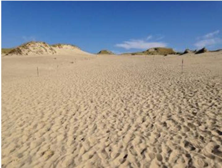
2014 metai, ruduo