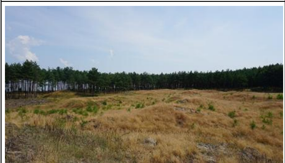
2021 metai, vasara