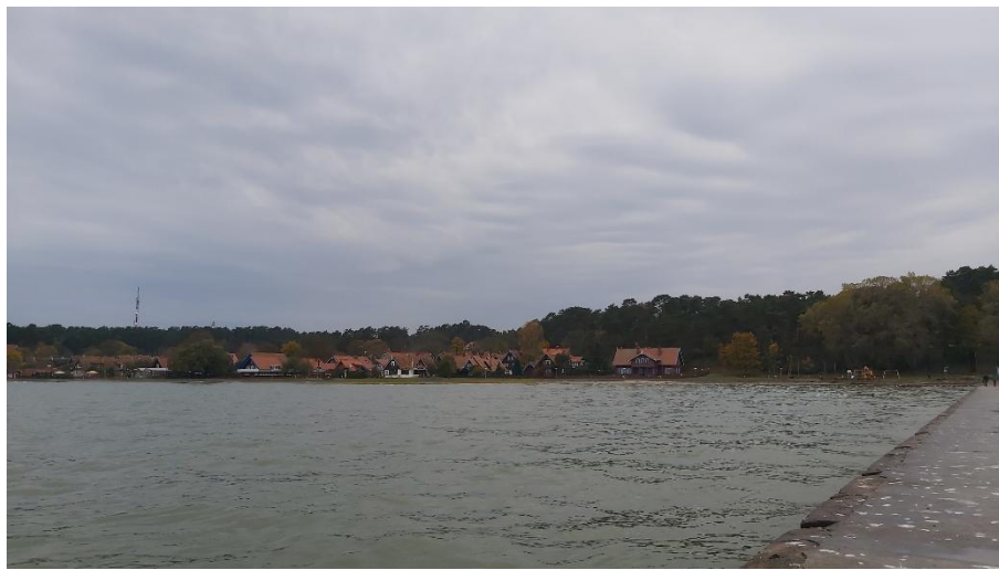
2023 metai, ruduo