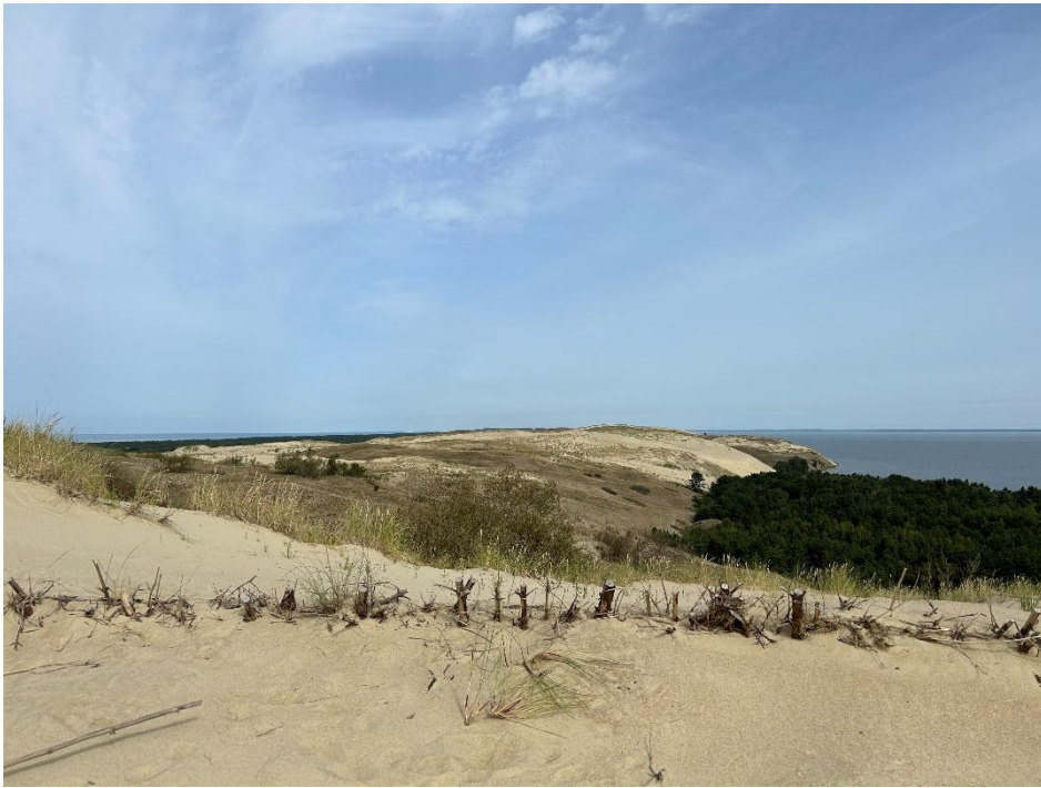
2023 metai, vasara