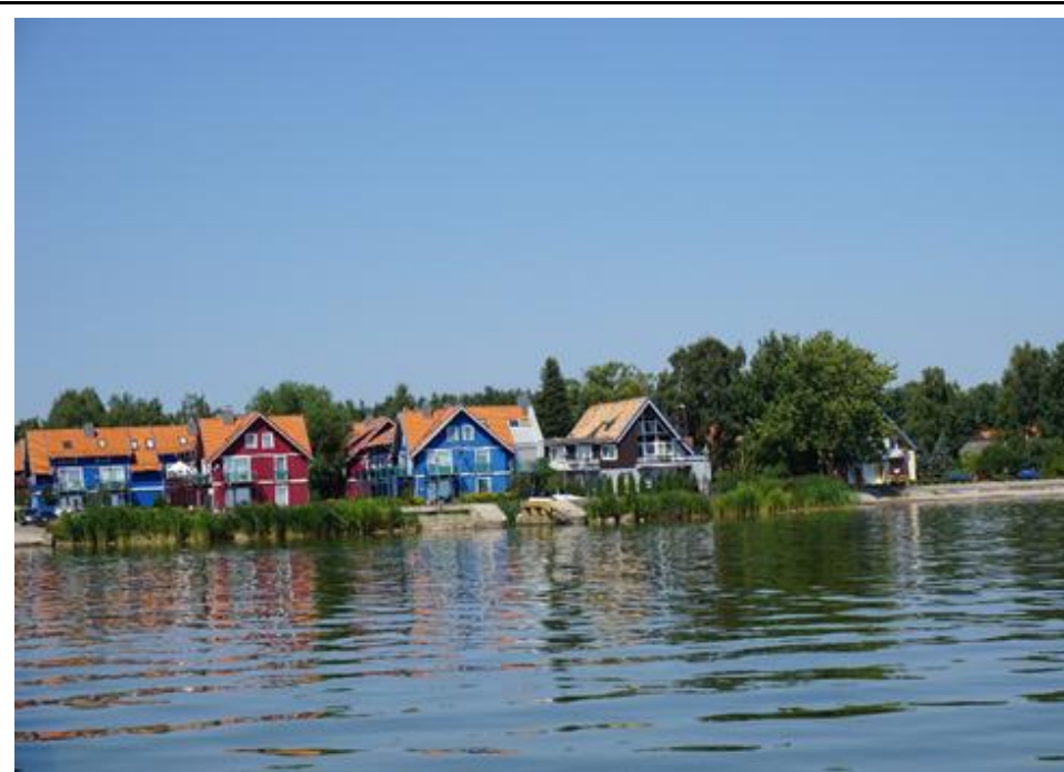
2015 metai, vasara