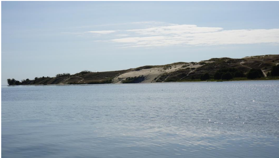
2016 metai, ruduo