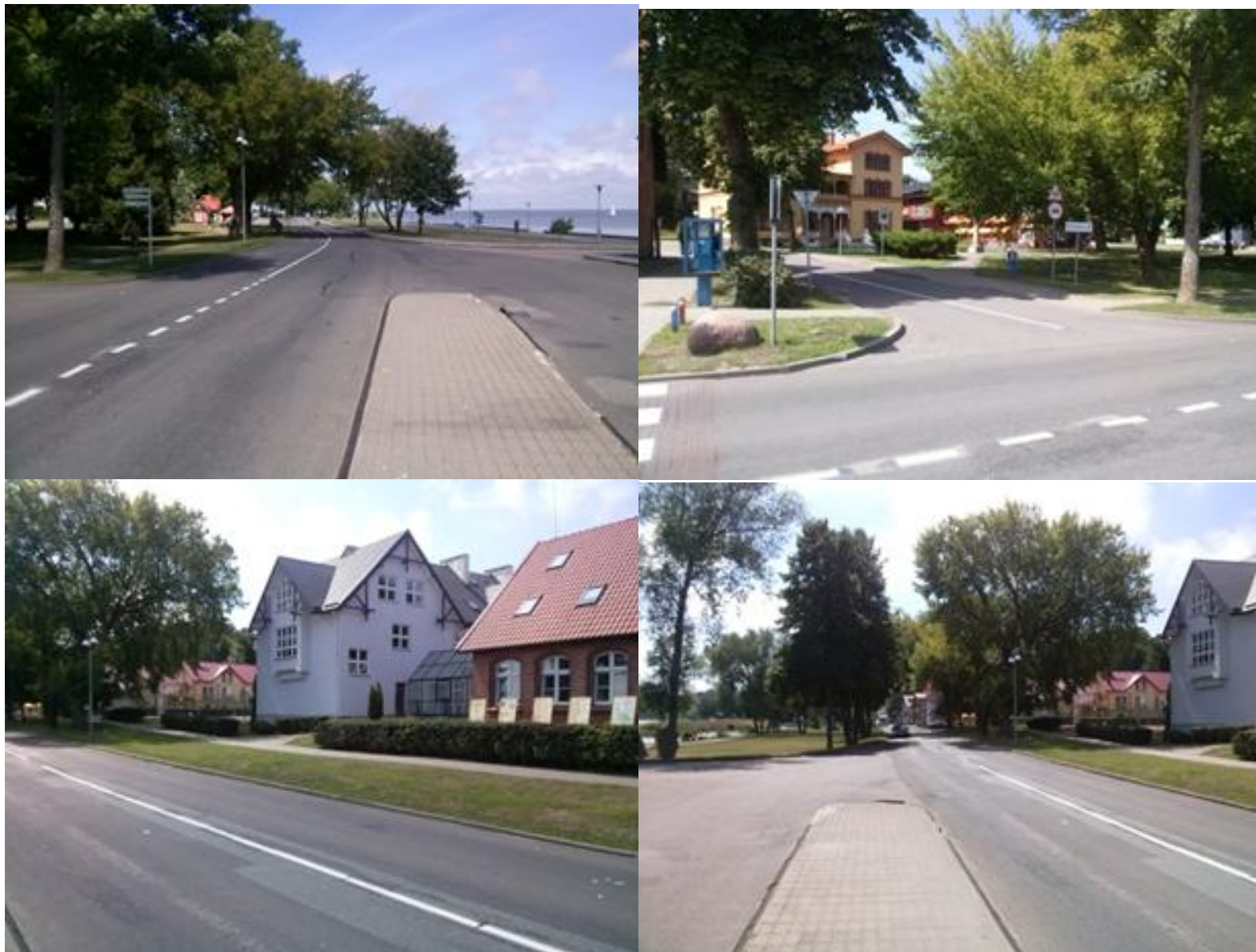
2014 m. Juodkrantė ties TIC, vasara