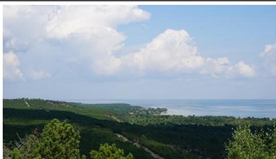
2020 metai, vasara