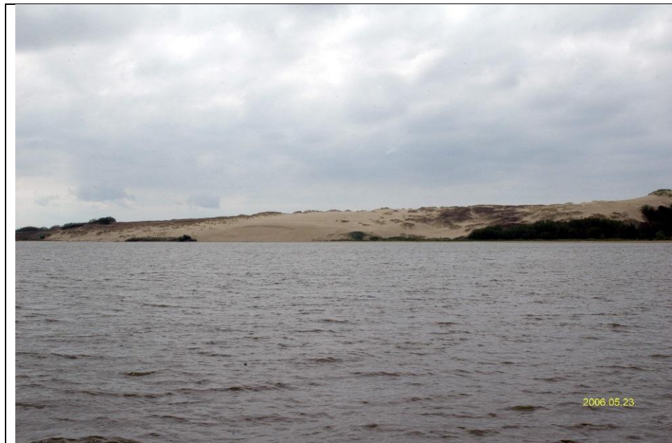
2006 metai, pavasaris