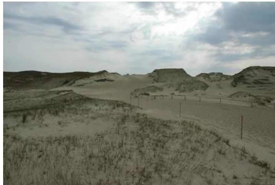
2008 metai, pavasaris