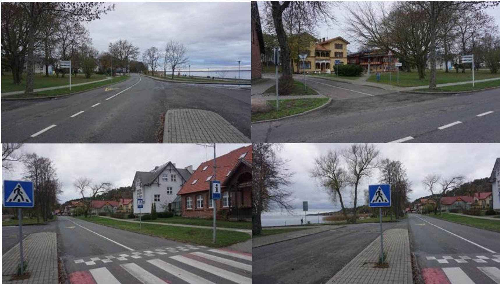
2019 m. Juodkrantė ties TIC, ruduo