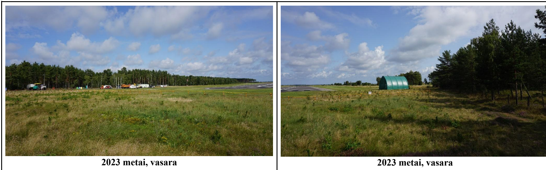
2023 metai, vasara