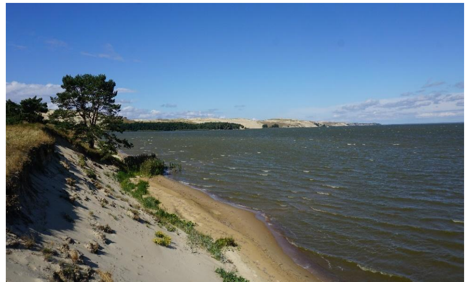
2022 metai, vasara