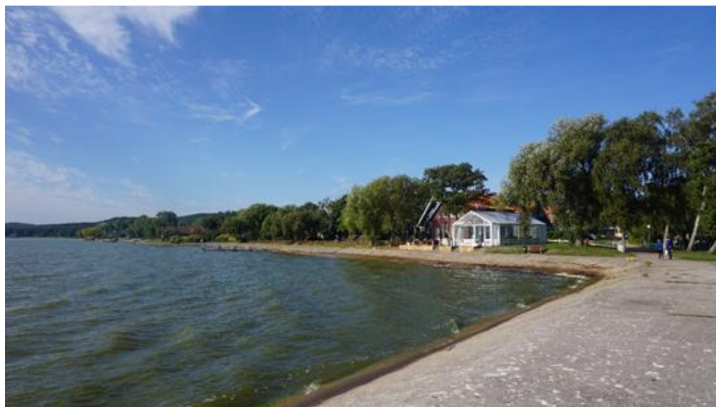
2020 metai, vasara