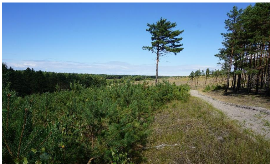
2022 metai, ruduo