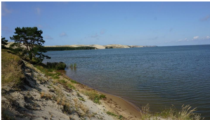
2023 metai, vasara