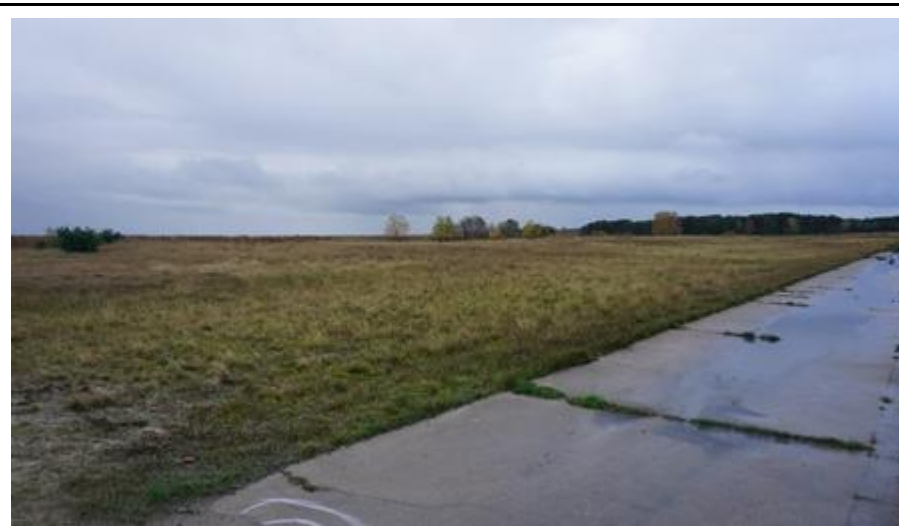
2019 metai, ruduo