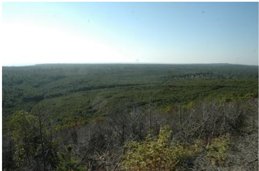
2006 metai, ruduo