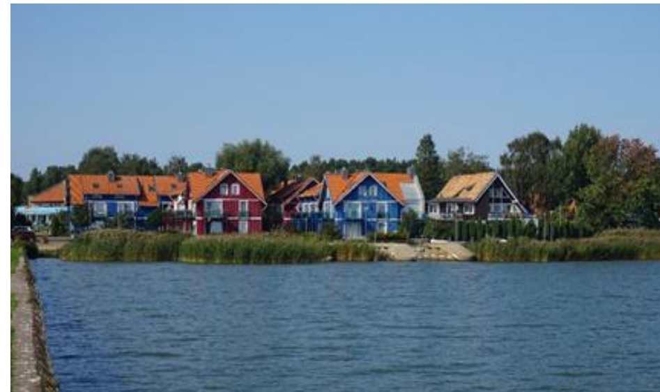
2020 metai, vasara