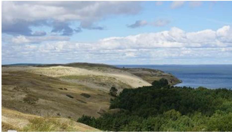
2021 metai, vasara