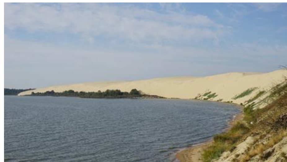
2020 metai, vasara