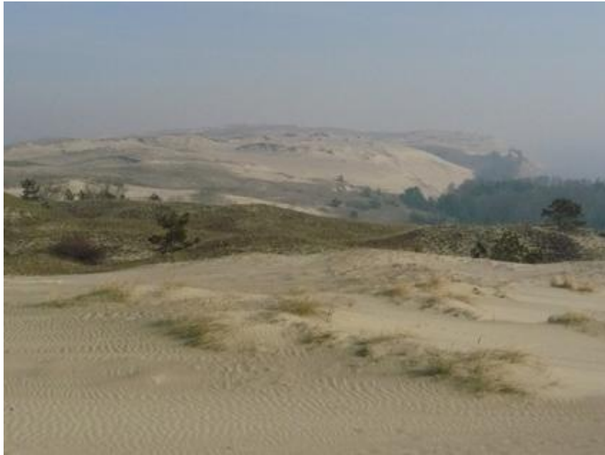
2009 metai, pavasaris