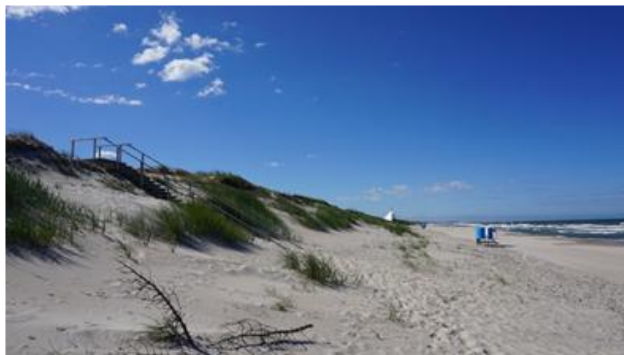
2017 metai, vasara