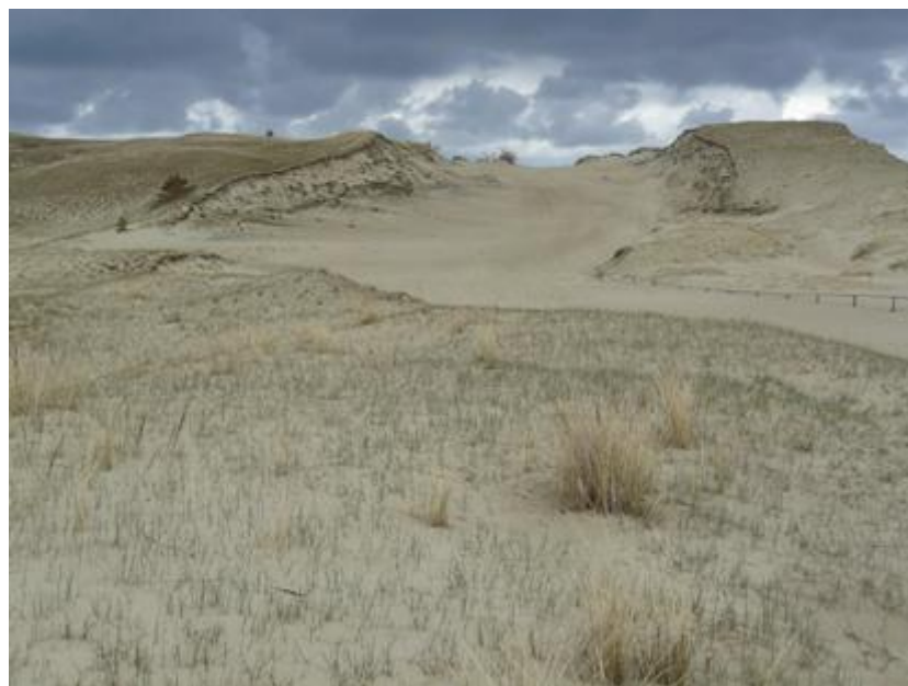
2010 metai, gegužē