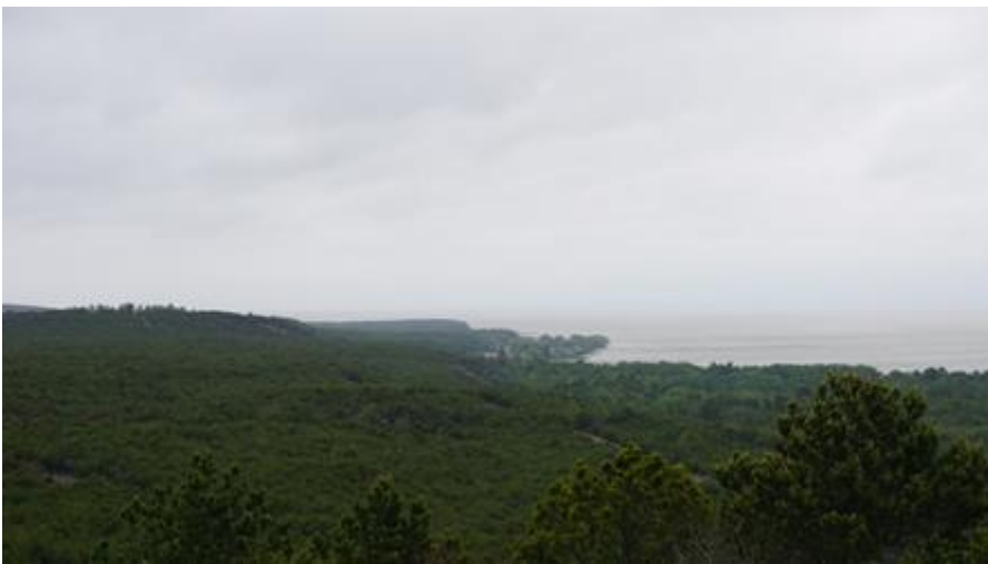
2017 metai, vasara