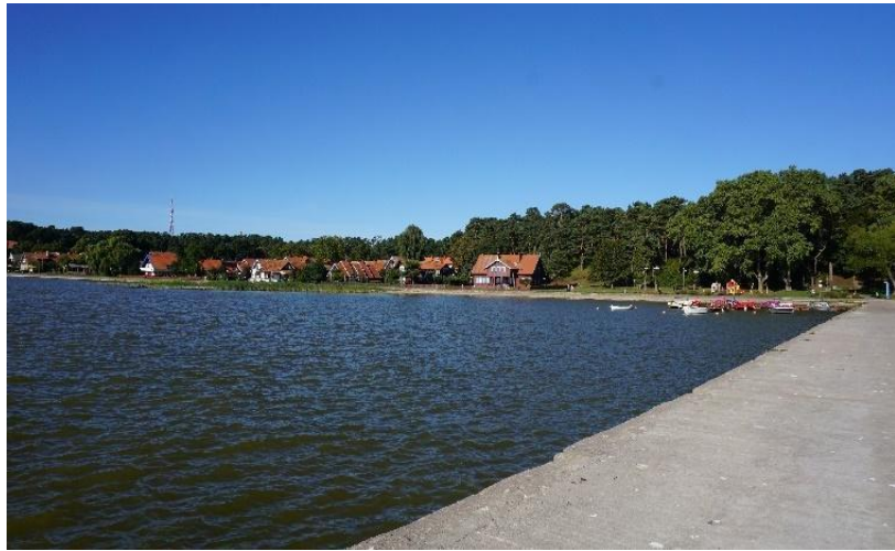
2022 metai, ruduo