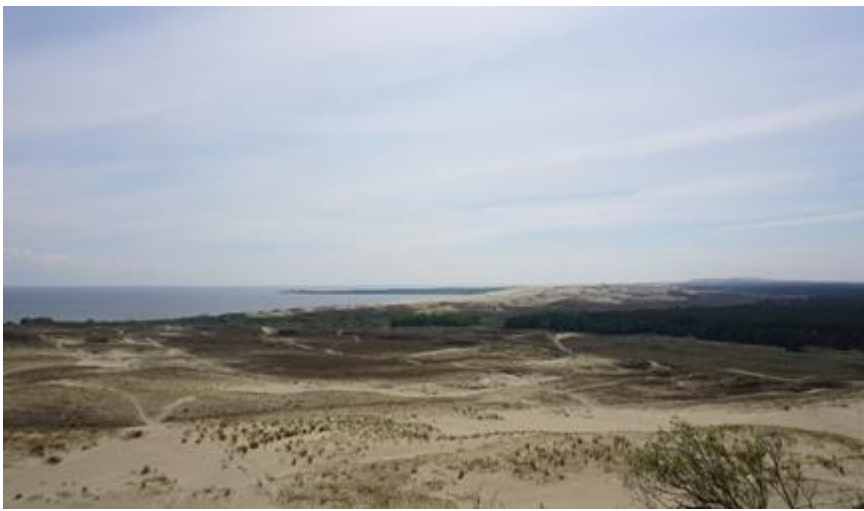
2021 metai, pavasaris