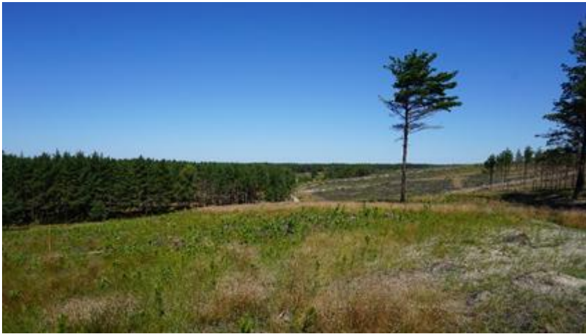
2016 metai, vasara