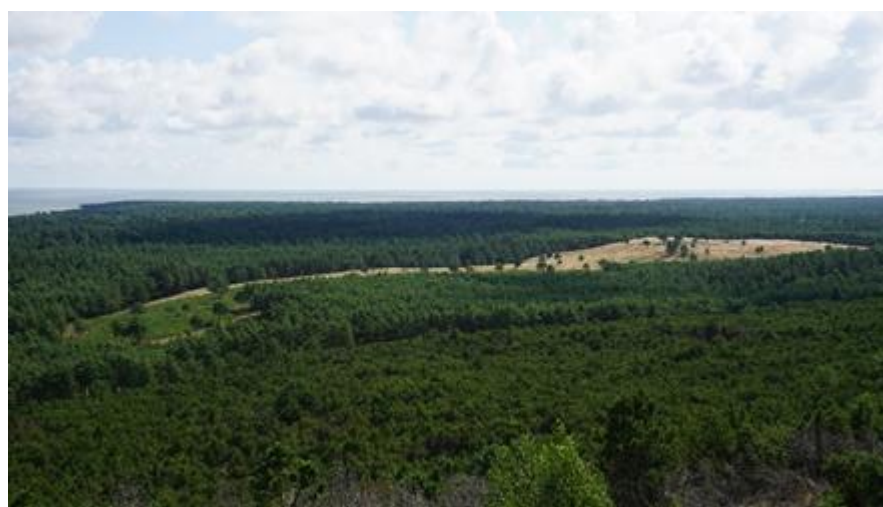
2021 metai, vasara