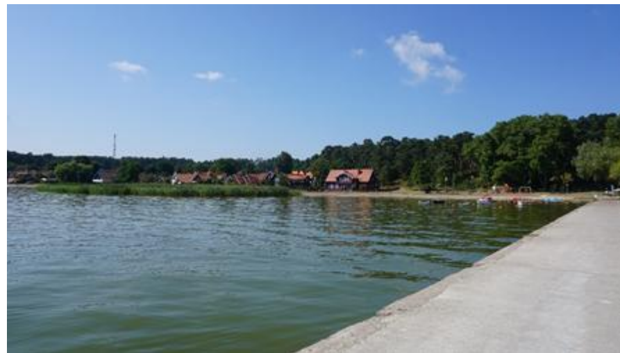
2020 metai, vasara