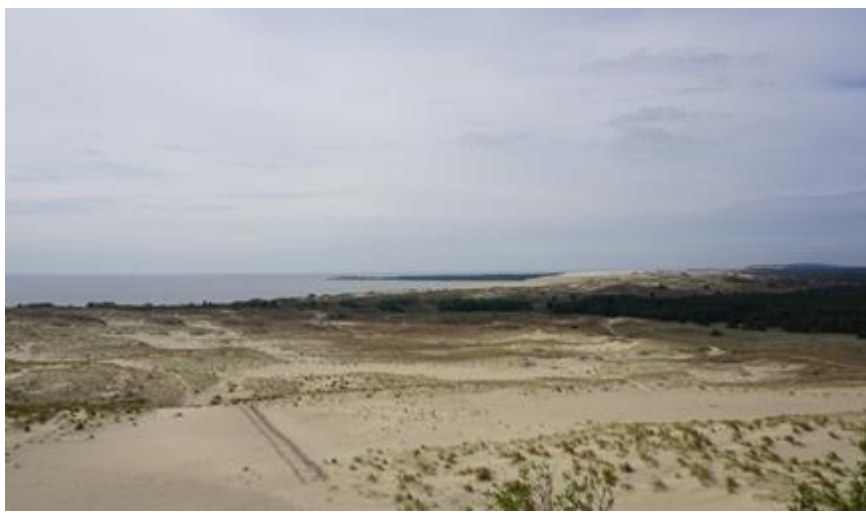
2017 metai, vasara