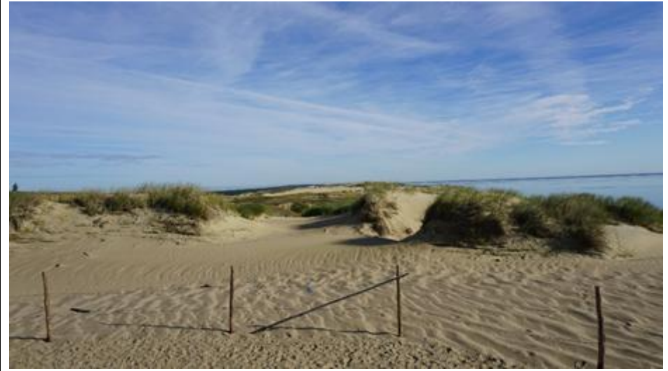
2016 metai, ruduo