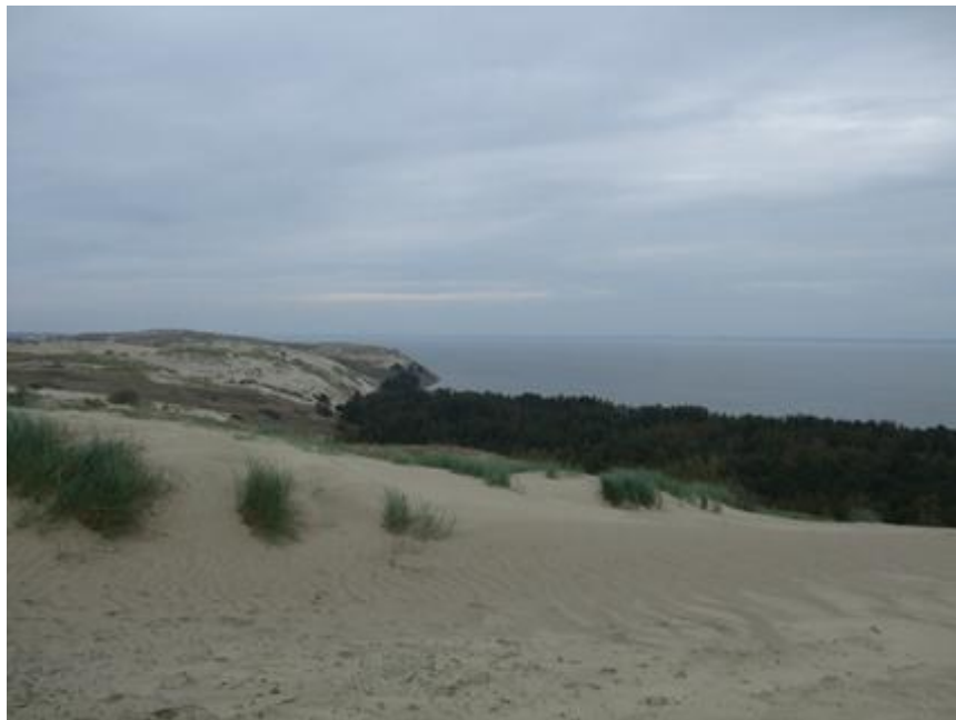
2012 metai, ruduo