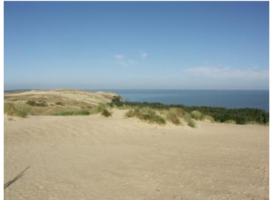
2014 metai, ruduo