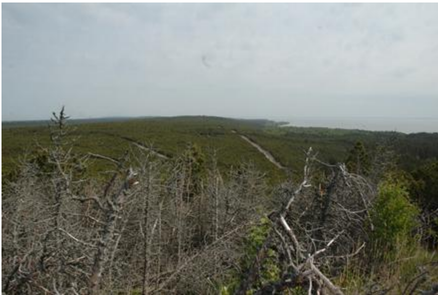
2008 metai, pavasaris