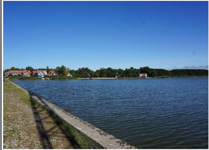
2022 metai, ruduo