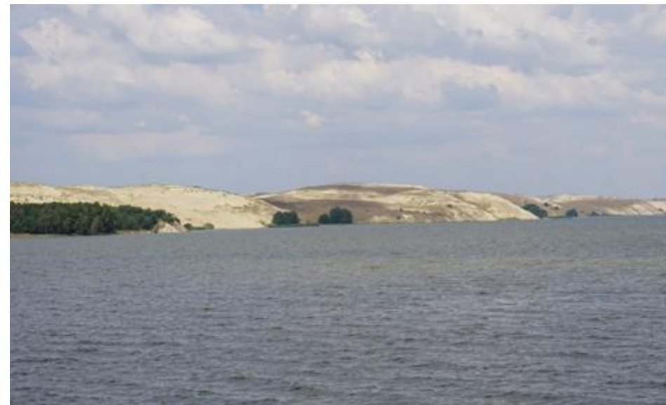
2018 metai, vasara