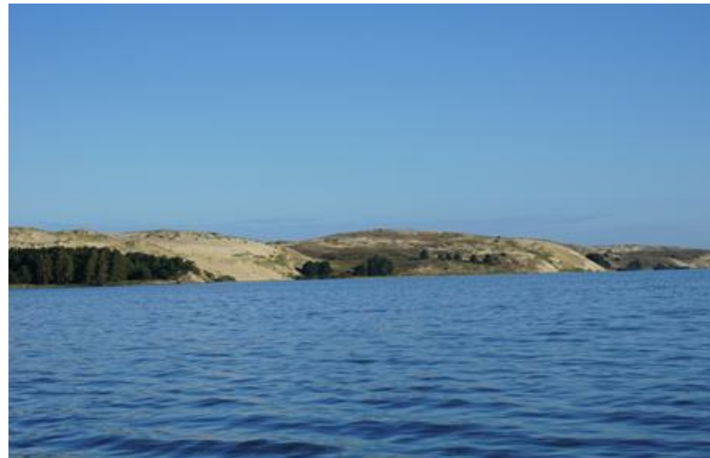
2016 metai, ruduo