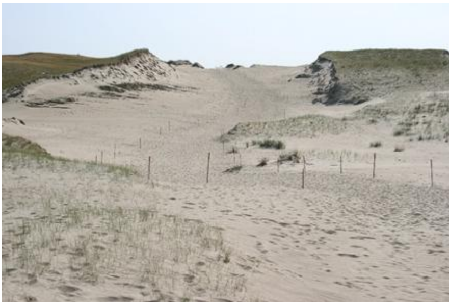
2007 metai, vasara