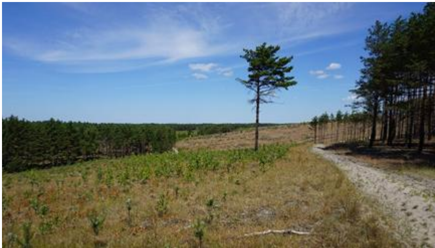
2018 metai, vasara