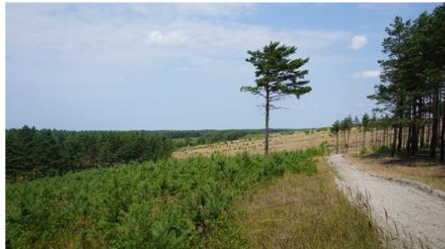
2021 metai, vasara