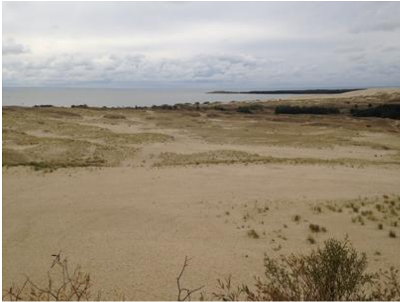
2014 metai, ruduo