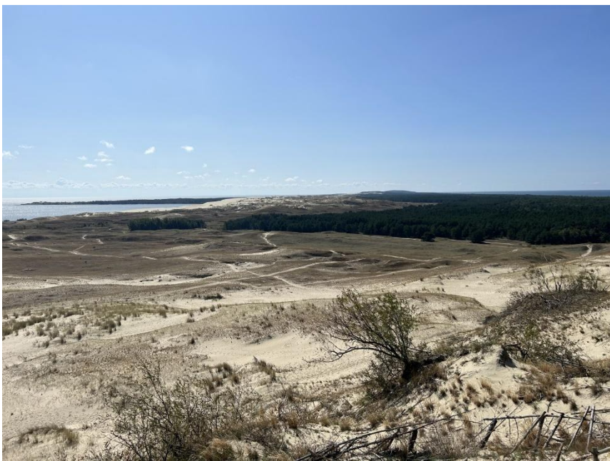
2023 metai, vasara