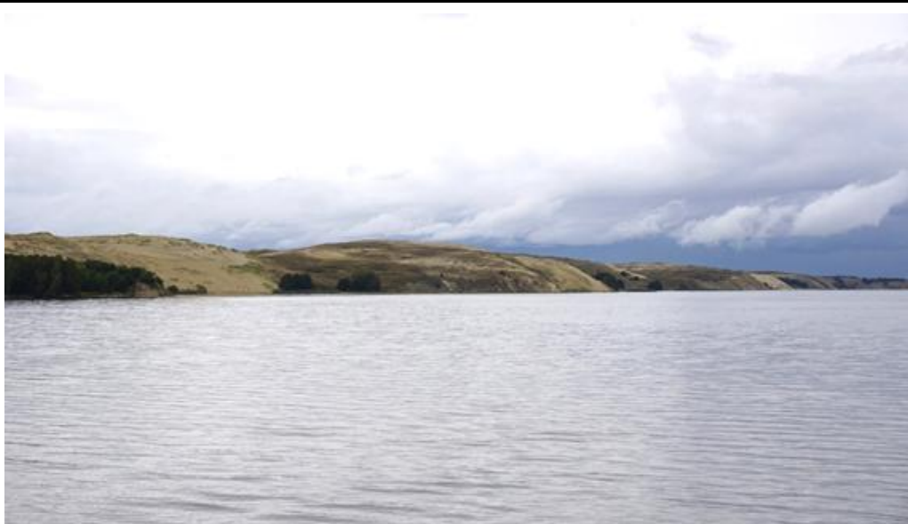
2019 metai, ruduo