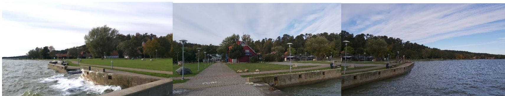
2023 metai, ruduo