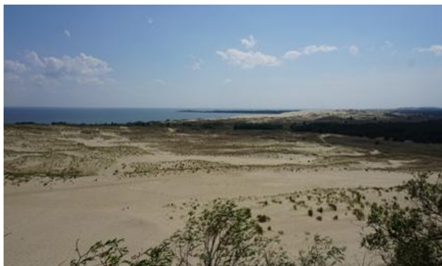
2016 metai, pavasaris