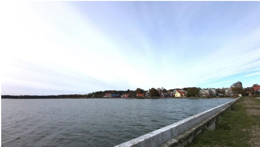
2023 metai, ruduo