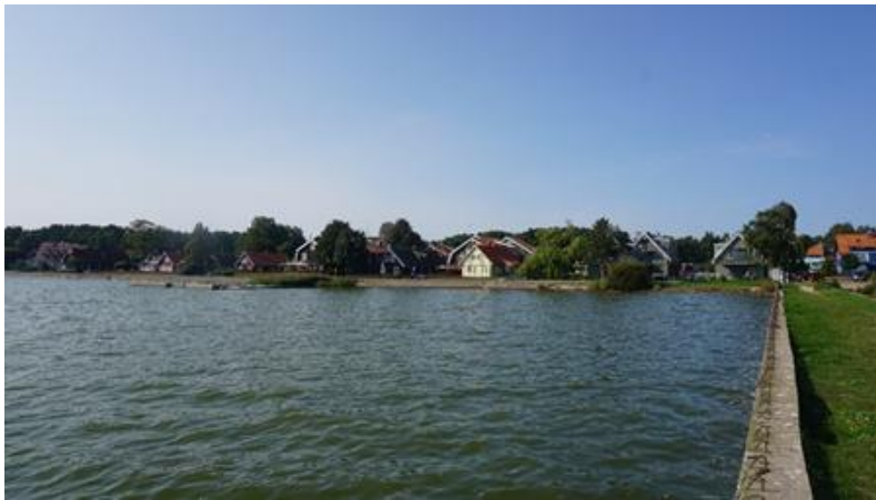
2020 metai, vasara