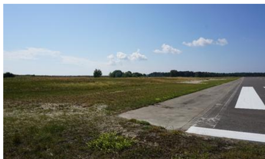
2020 metai, vasara