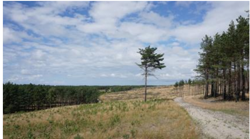
2017 metai, vasara