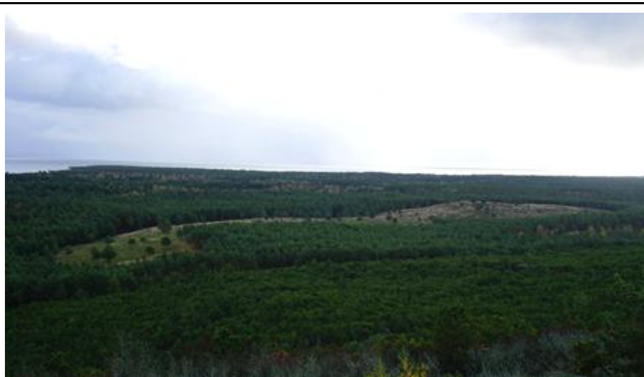
2019 metai, ruduo