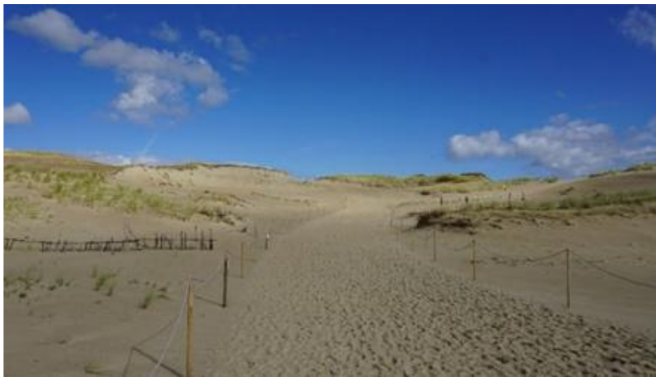
2021 metai, vasara