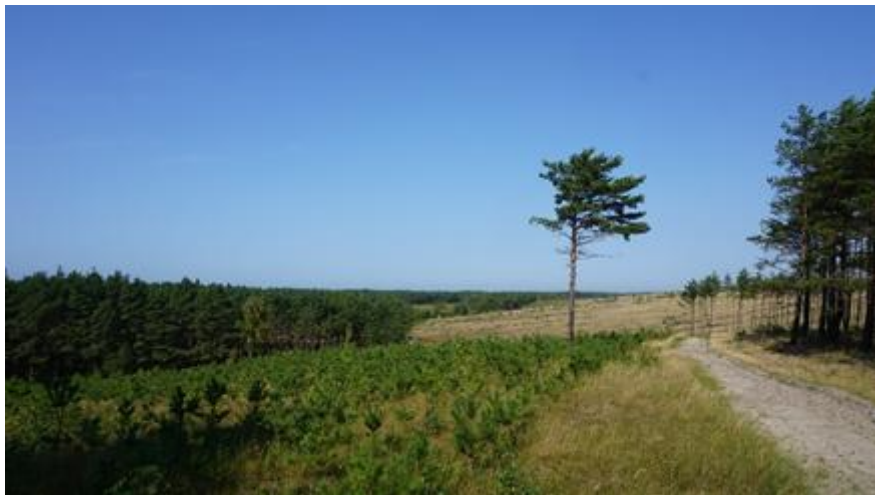
2020 metai, vasara