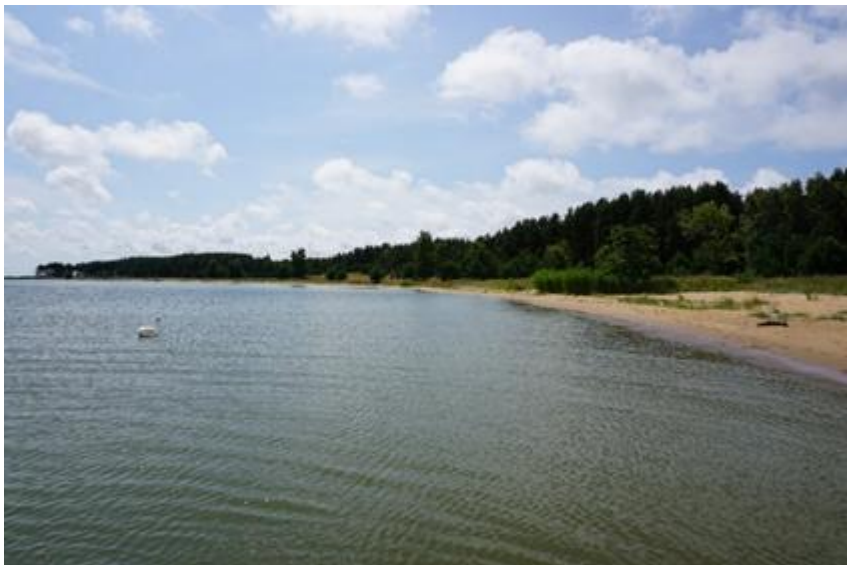
2015 metai, vasara