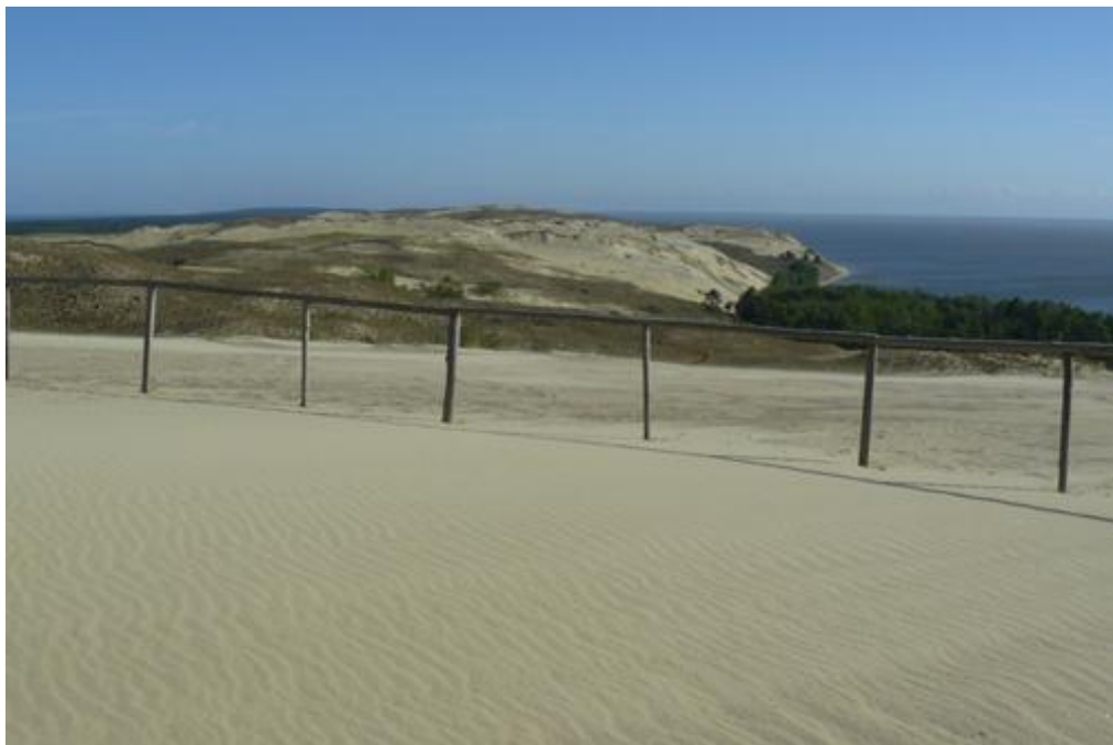
2011 metai, pavasaris