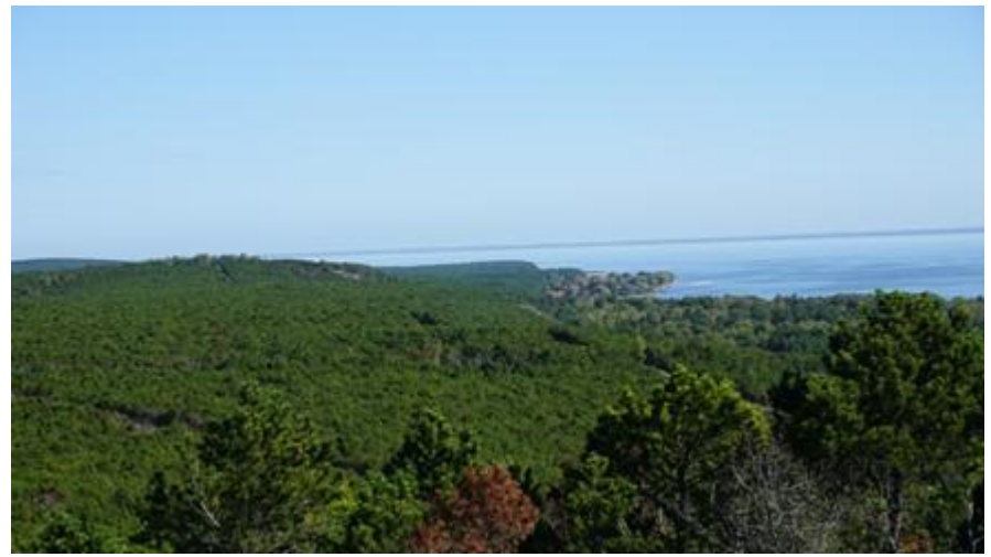
2016 metai, ruduo