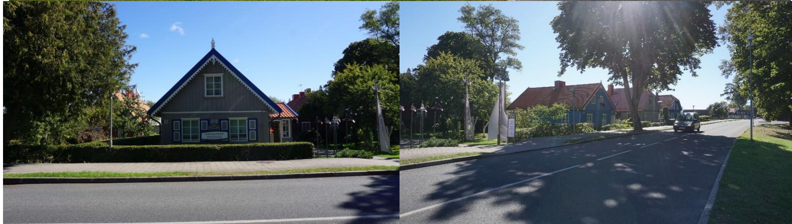
2022 metai, ruduo