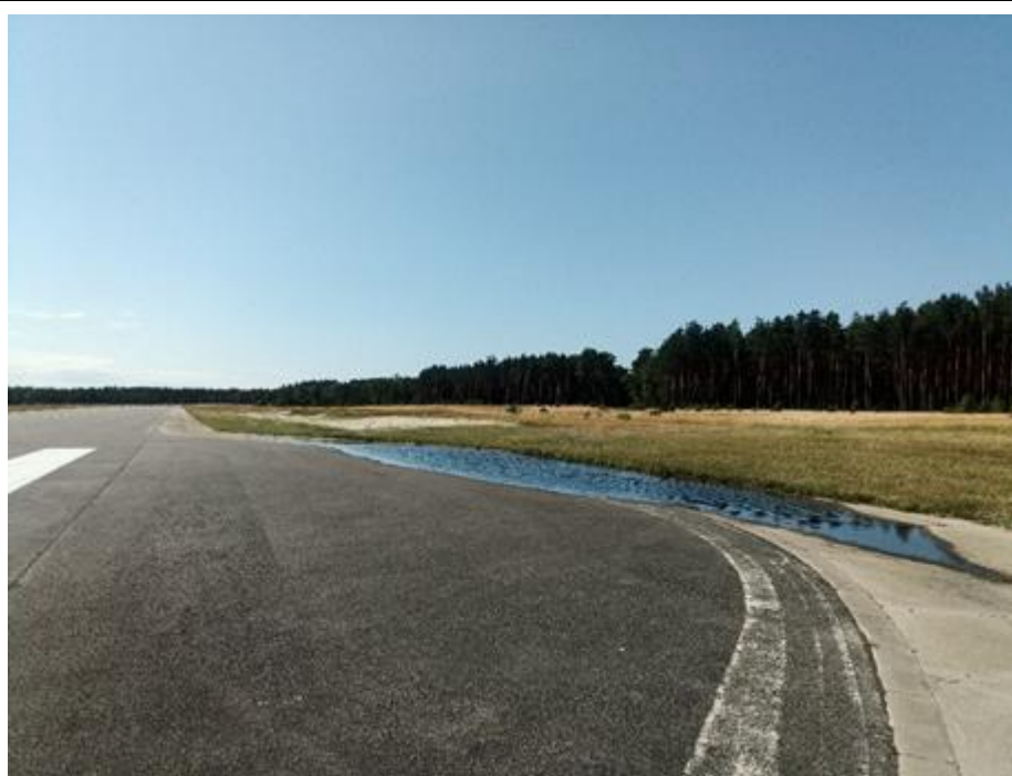
2021 metai, vasara