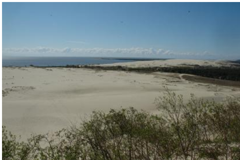
2006 metai, pavasaris