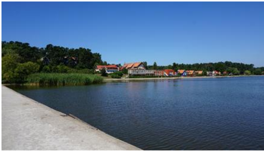
2018 metai, vasara