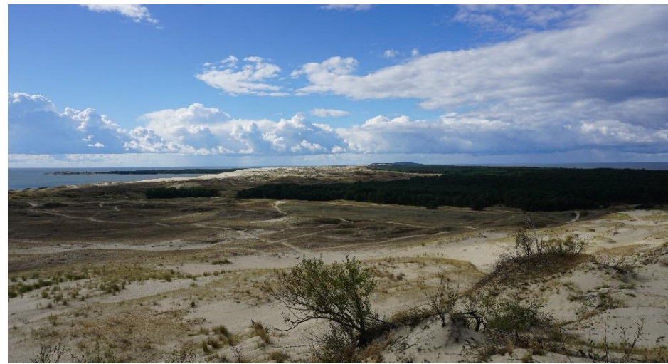
2022 metai, vasara