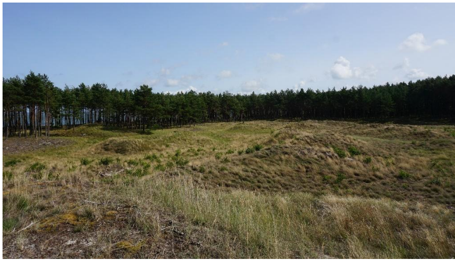
2023 metais, vasara