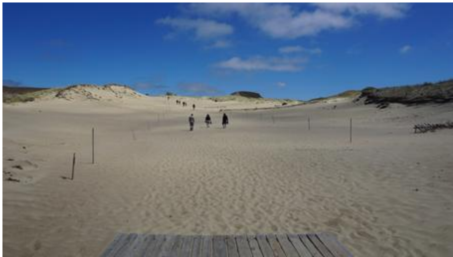
2017 metai, vasara