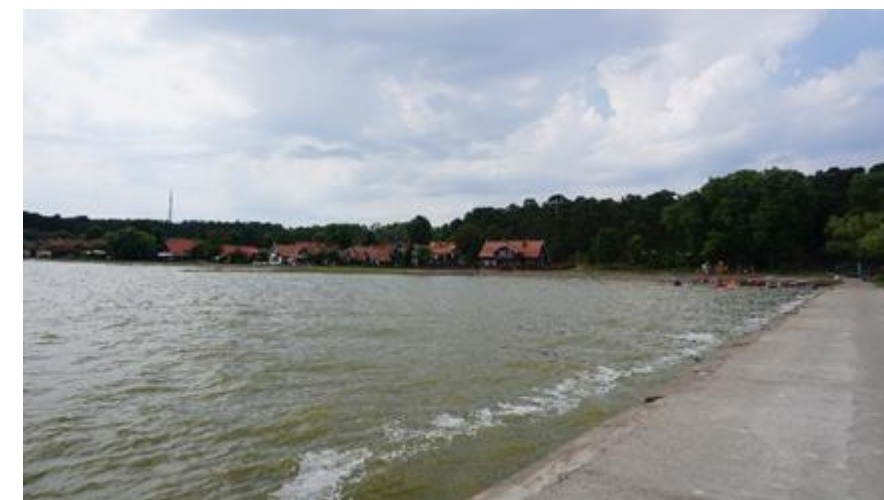
2021 metai, vasara