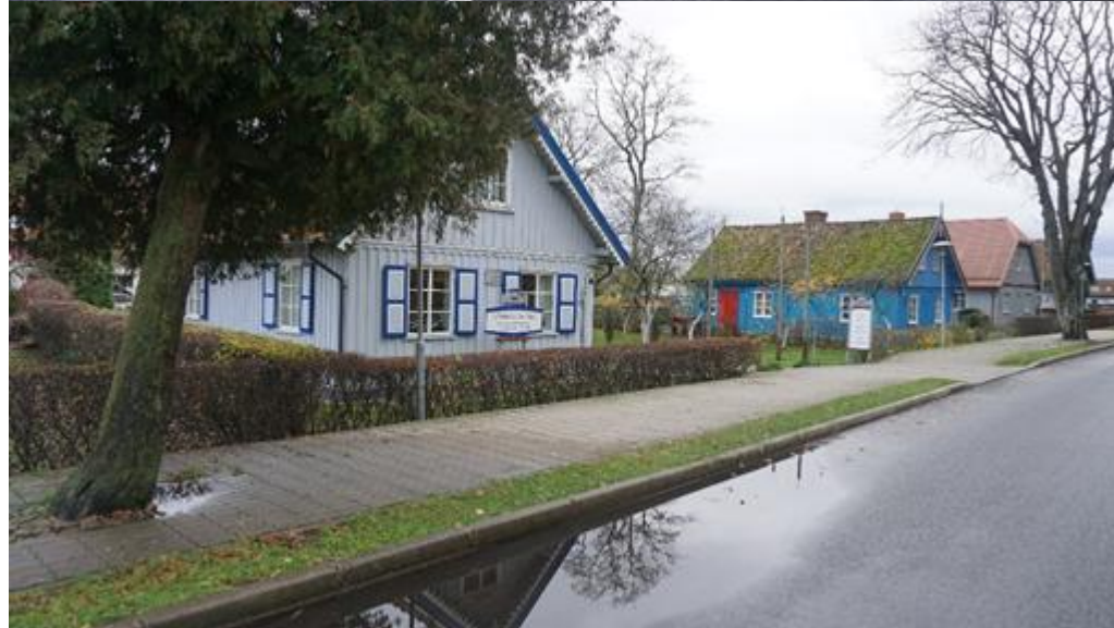
2019 m. Juodkrantės bažnyčia, ruduo