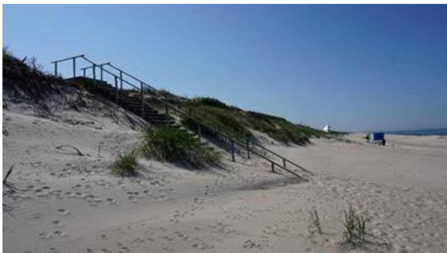
2016 metai, pavasaris