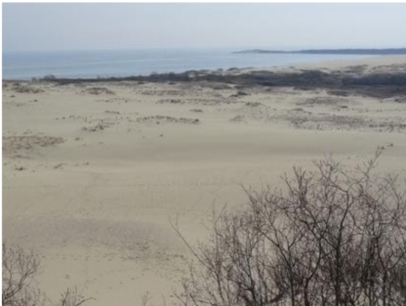
2009 metai, pavasaris