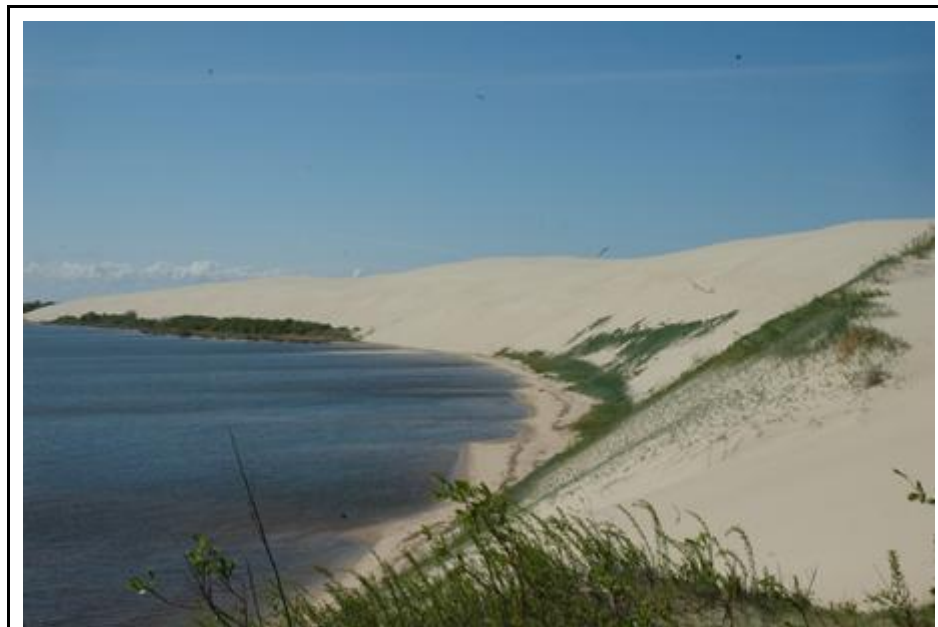
2006 metai, pavasaris