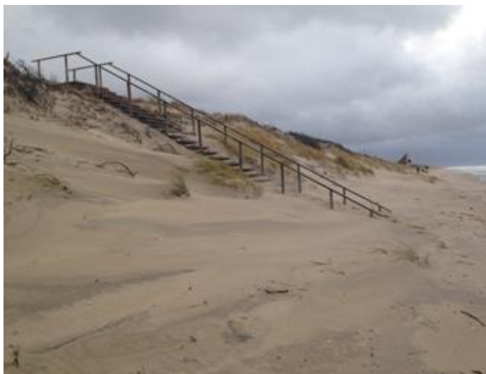
2015 metai, lapkričio pabaiga