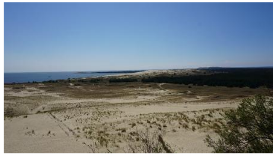
2018 metai, vasara