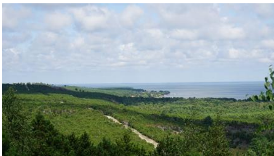
2021 metai, vasara