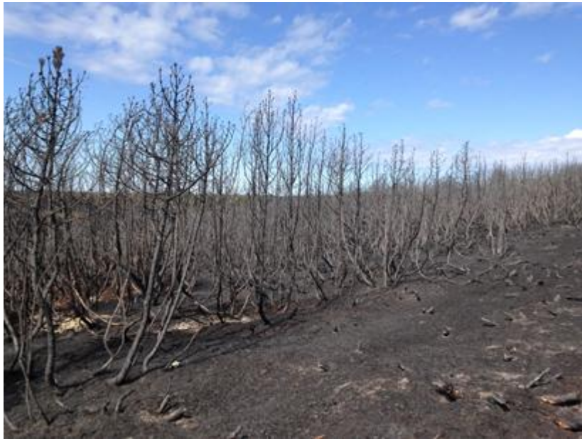
Po 2014 metų gaisro nudegusios kalnapušės, gegužė