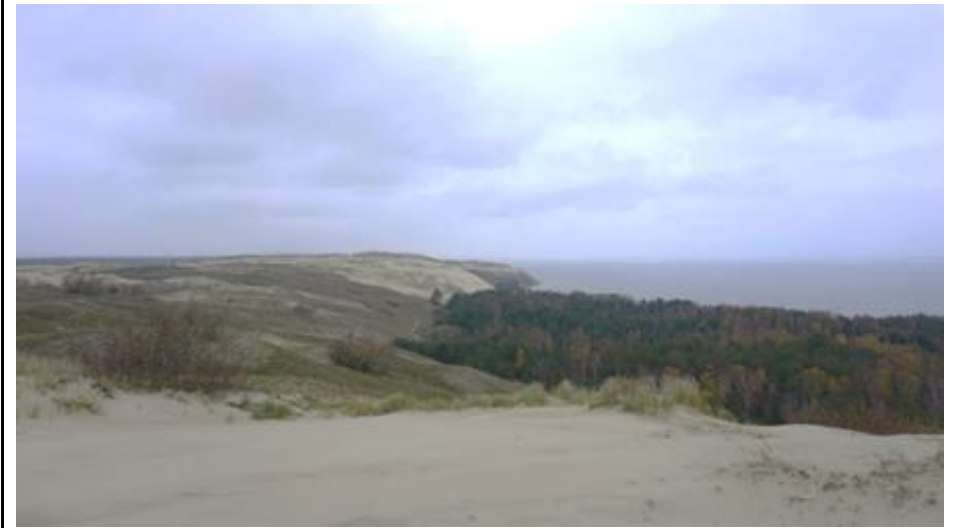
2020 metai, ruduo