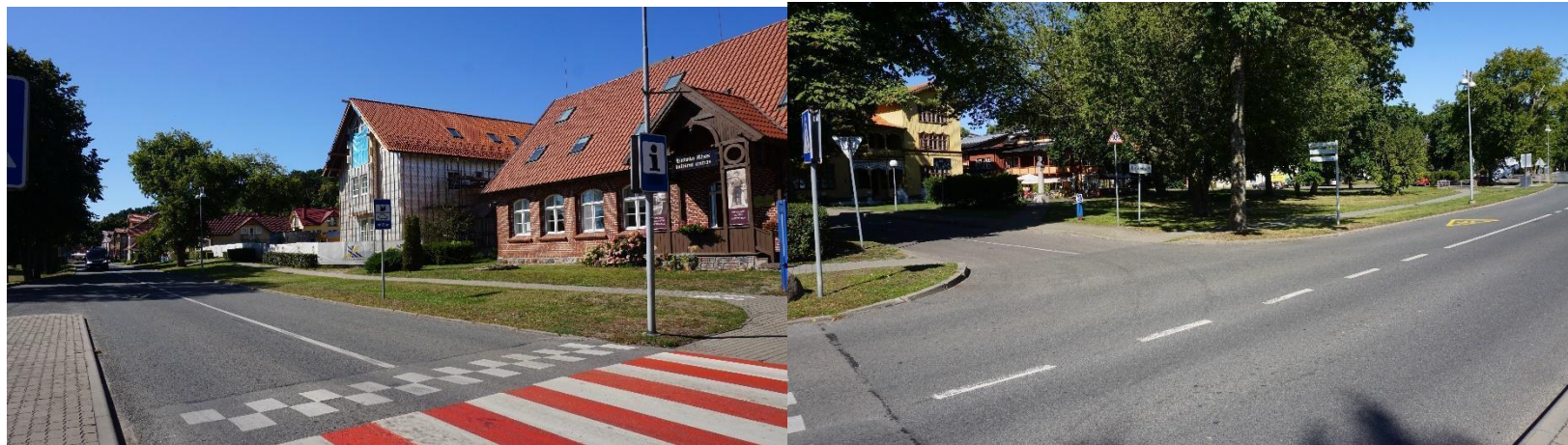
2022 metai, ruduo