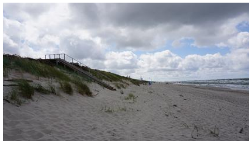
2019 metai, vasara