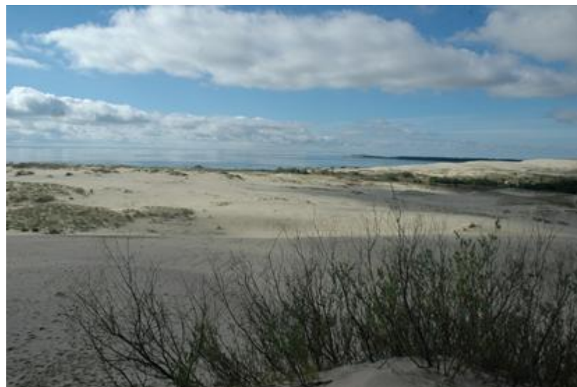
2007 metai, vasara