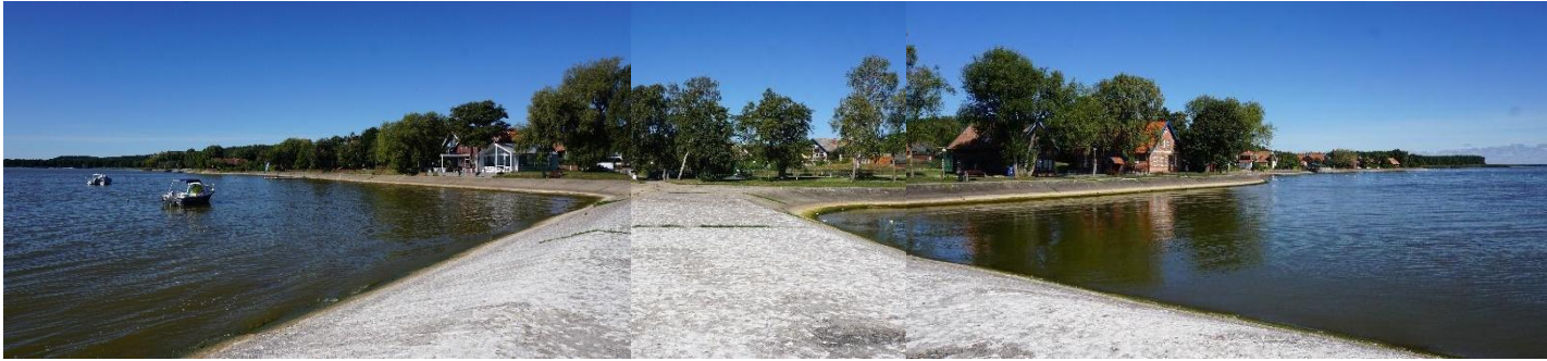
2022 metai, ruduo