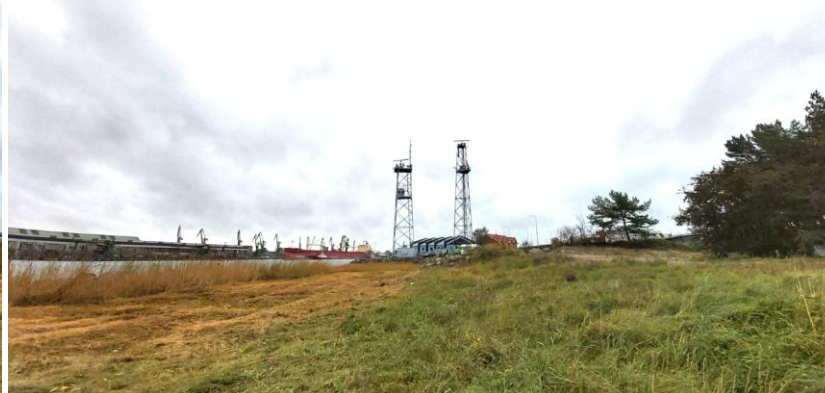
2023 metai, ruduo