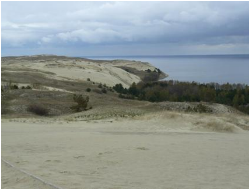
2010 metai, pavasaris