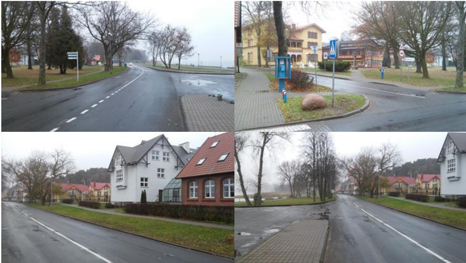
2014 m. Juodkrantė ties TIC, ruduo