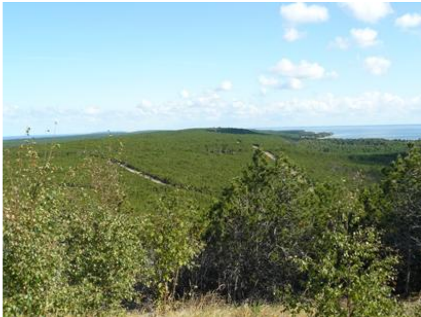
2009 metai, vasara