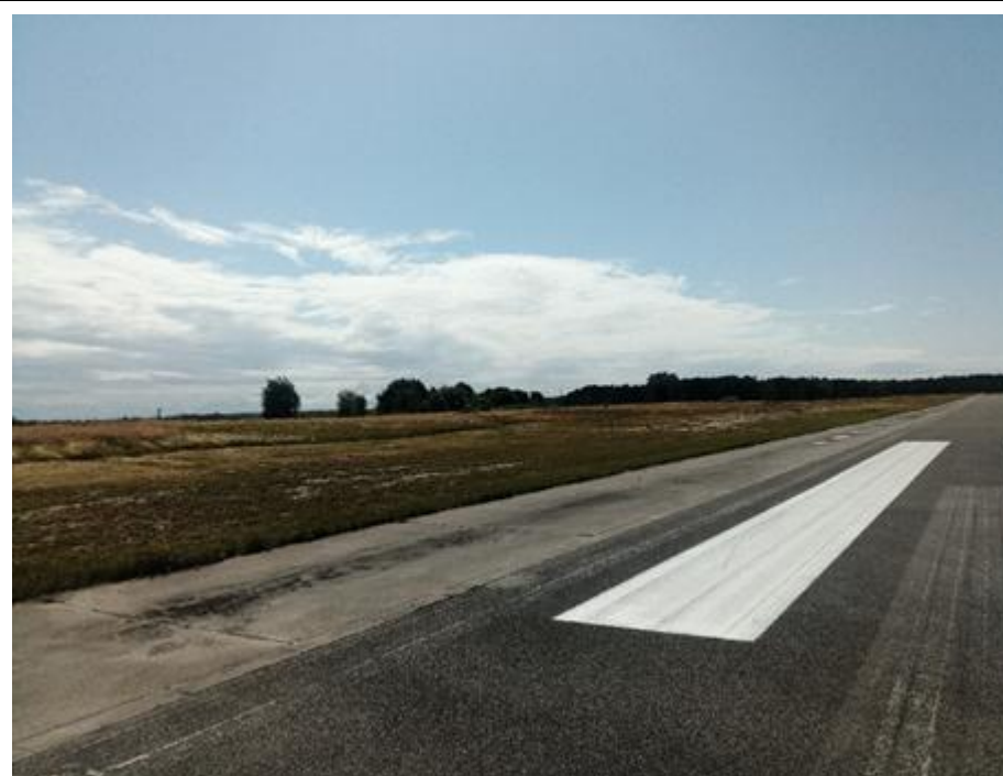
2021 metai, vasara