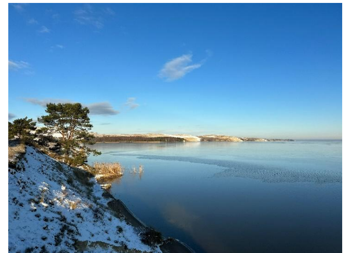
2023 metai, ruduo