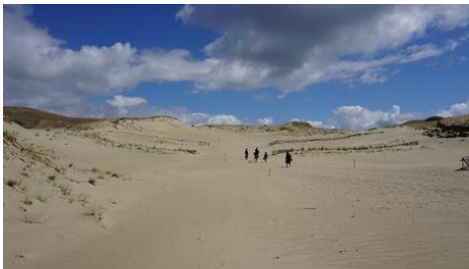
2019 metai, vasara