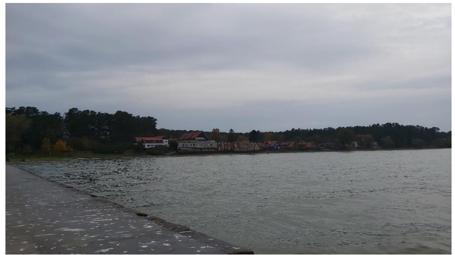
2023 metai, ruduo