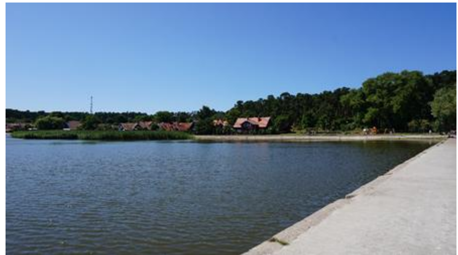
2018 metai, vasara