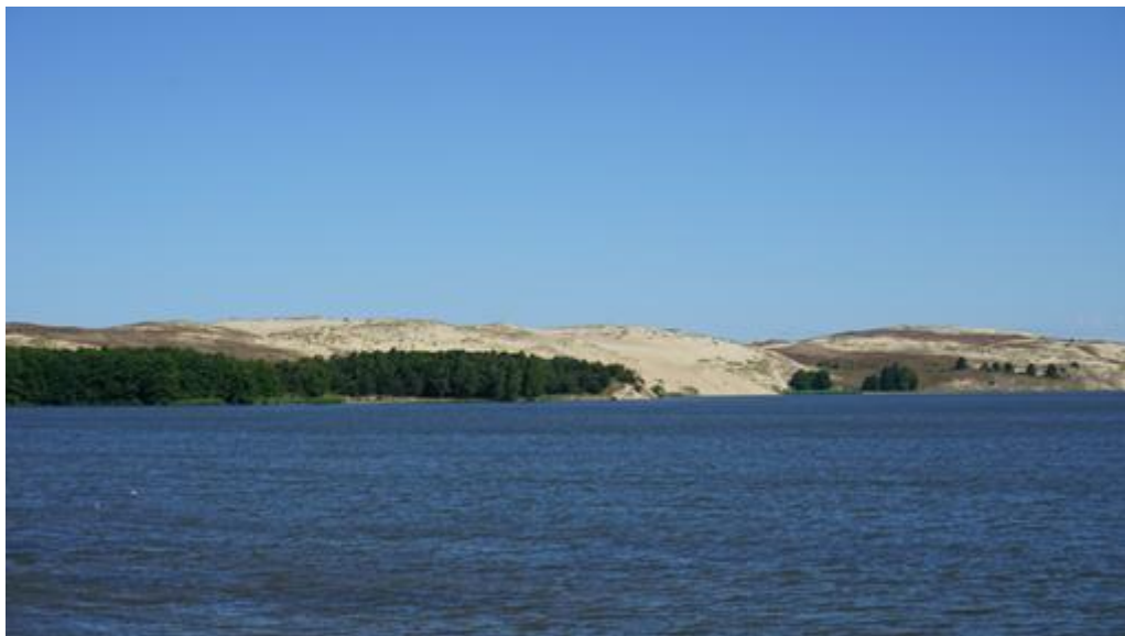
2017 metai, vasara