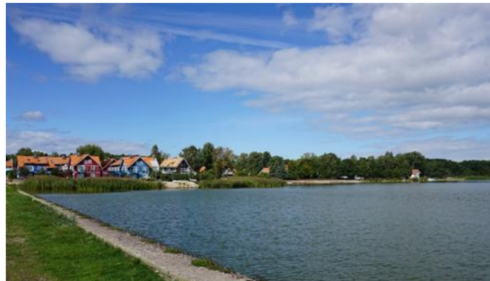
2021 metai, vasara