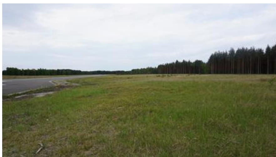
2016 metai, pavasaris