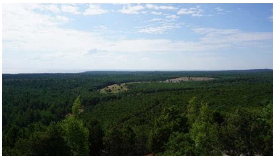
2018 metai, vasara