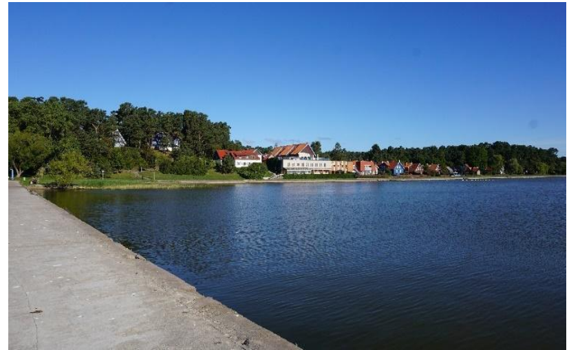
2022 metai, ruduo