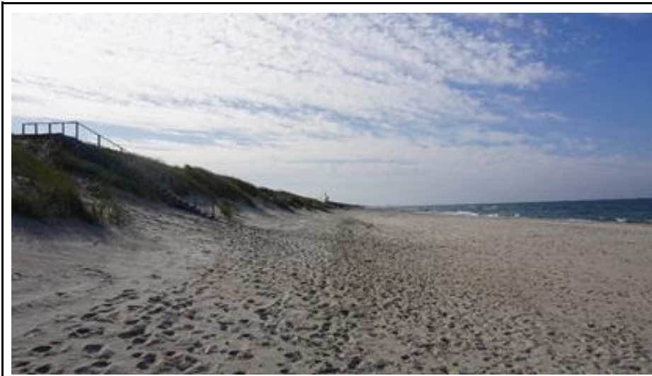
2020 metai, vasara