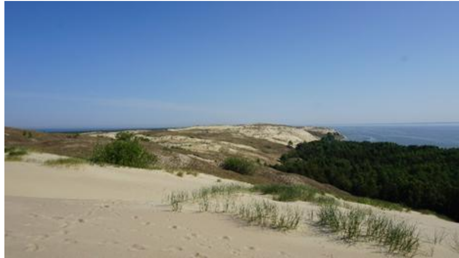
2016 metai, vasara