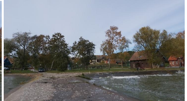
2023 metai, ruduo