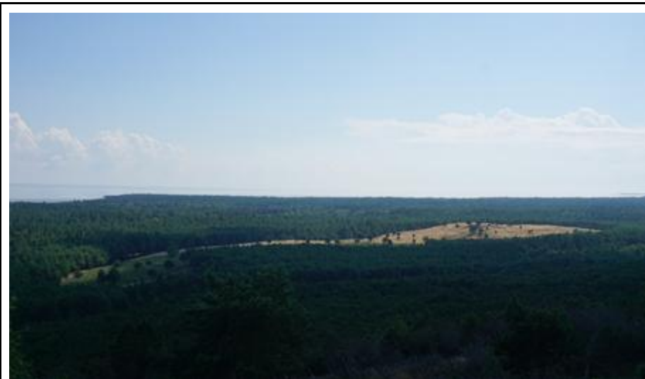
2020 metai, vasara