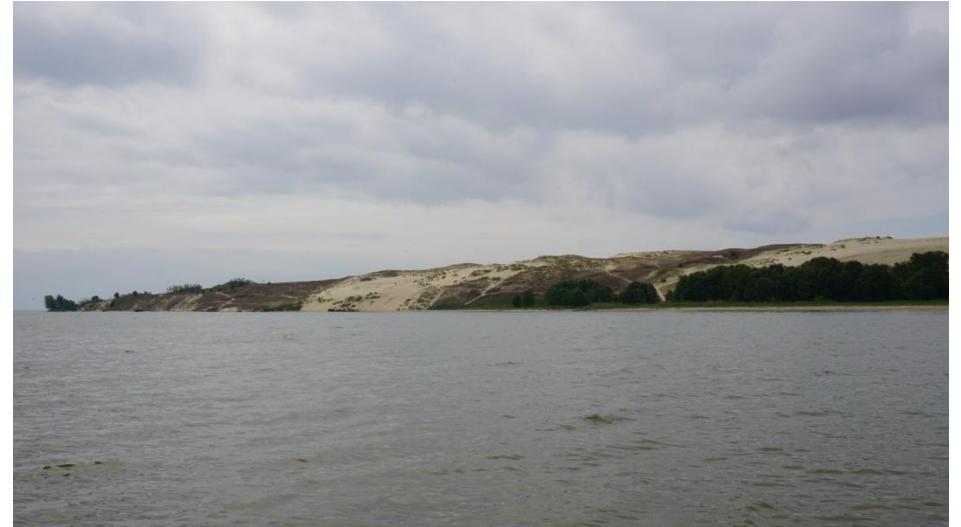
2017 metai, vasara