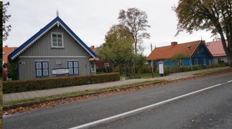
2021 m. Juodkrantės bažnyčia, ruduo