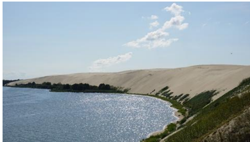
2018 metai, vasara