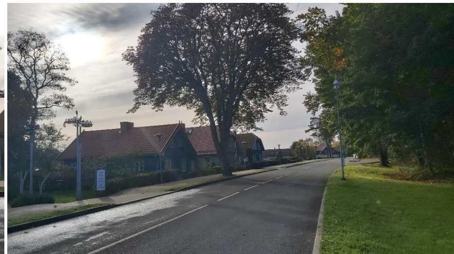
2023 metai, ruduo