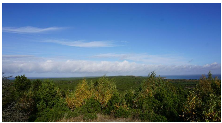
2022 metai, ruduo