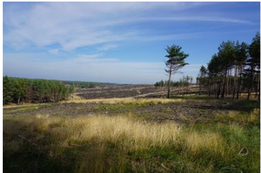
2015 metai, rudenio