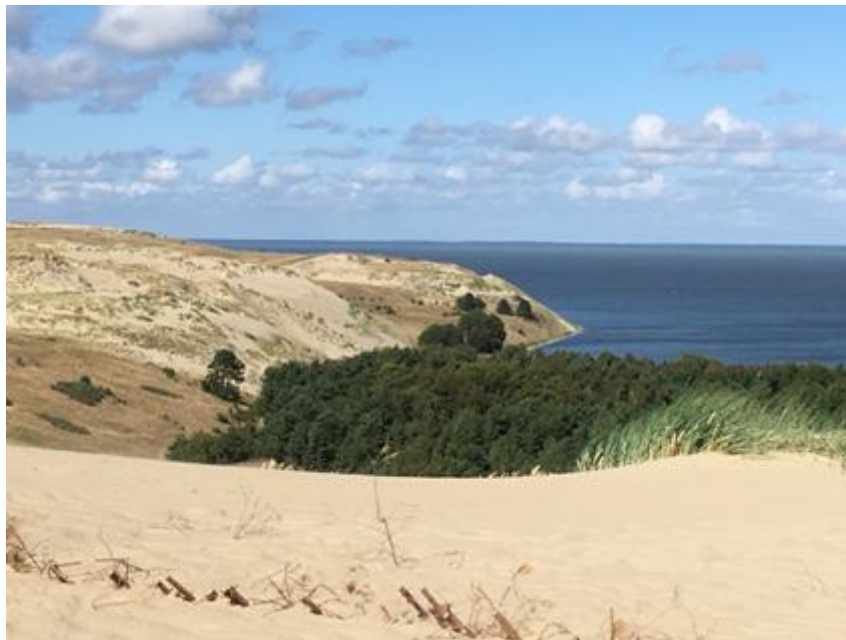
2016 metai, vasara