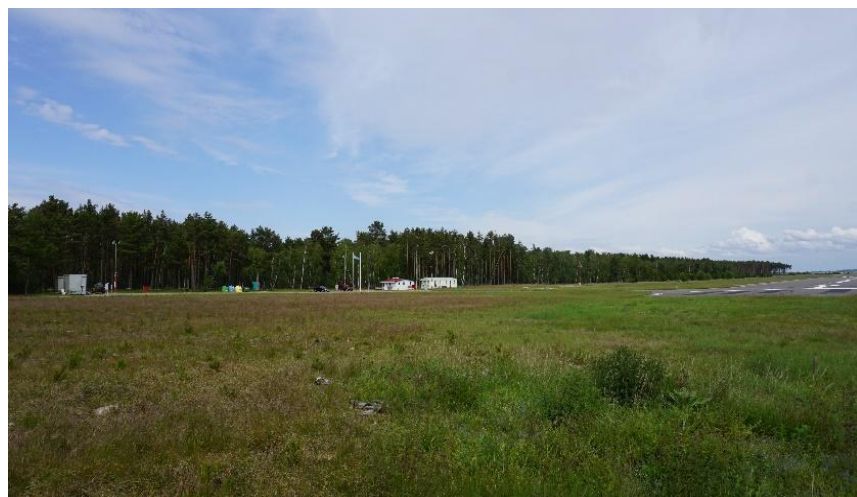
2022 metai, vasara