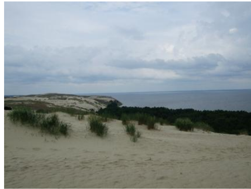
2013 metai, vasara