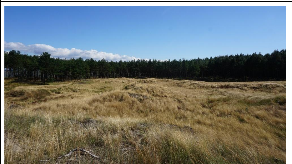
2022 metai, ruduo