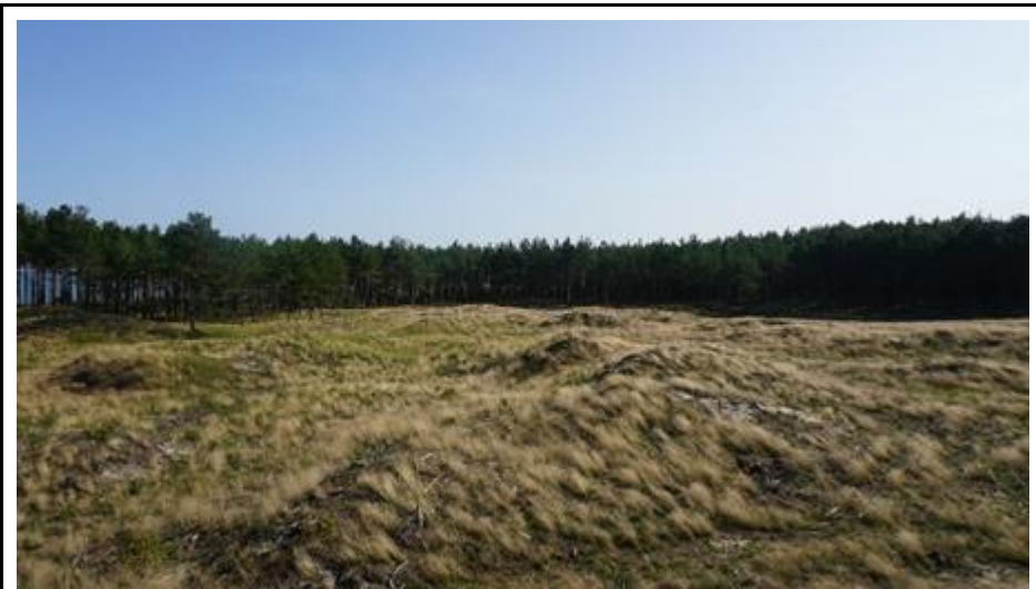
2020 metai, vasara