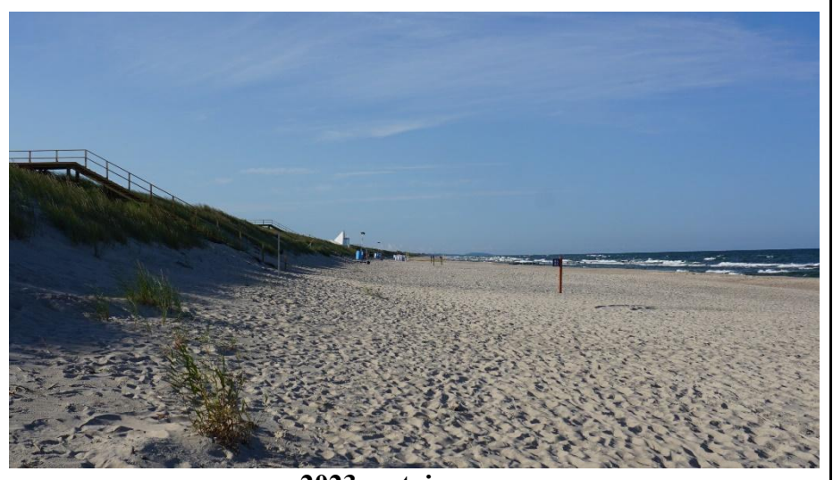
2023 metai, vasara