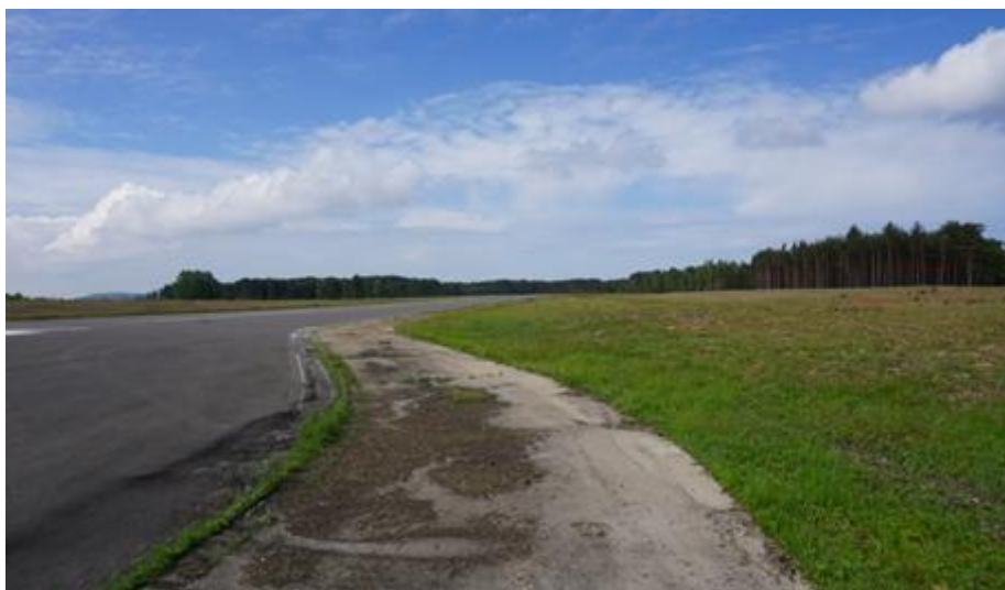
2017 metai, vasara