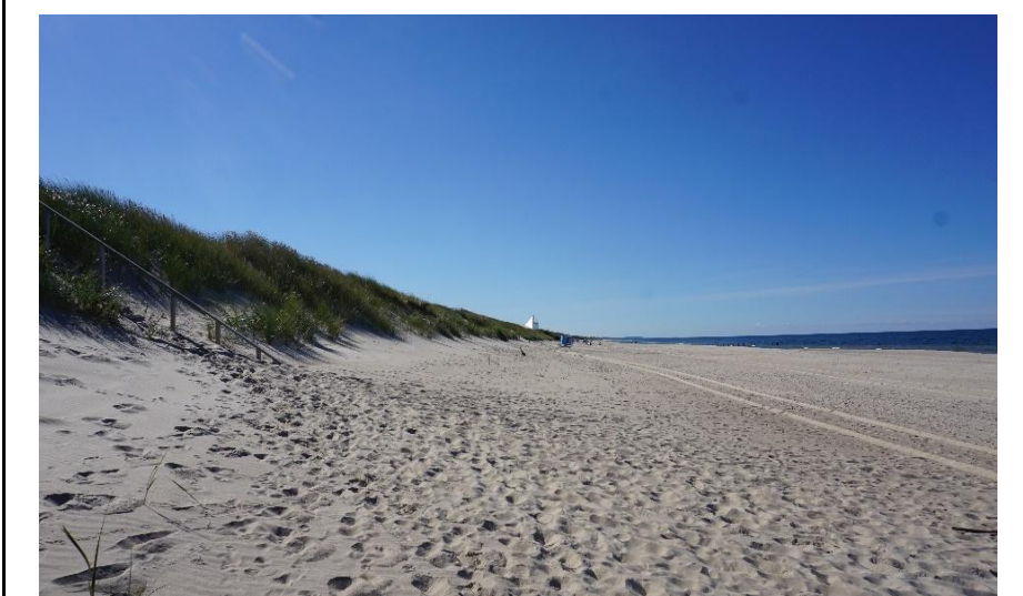
2022 metai, ruduo