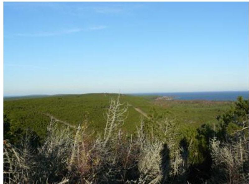
2008 metai, ruduo