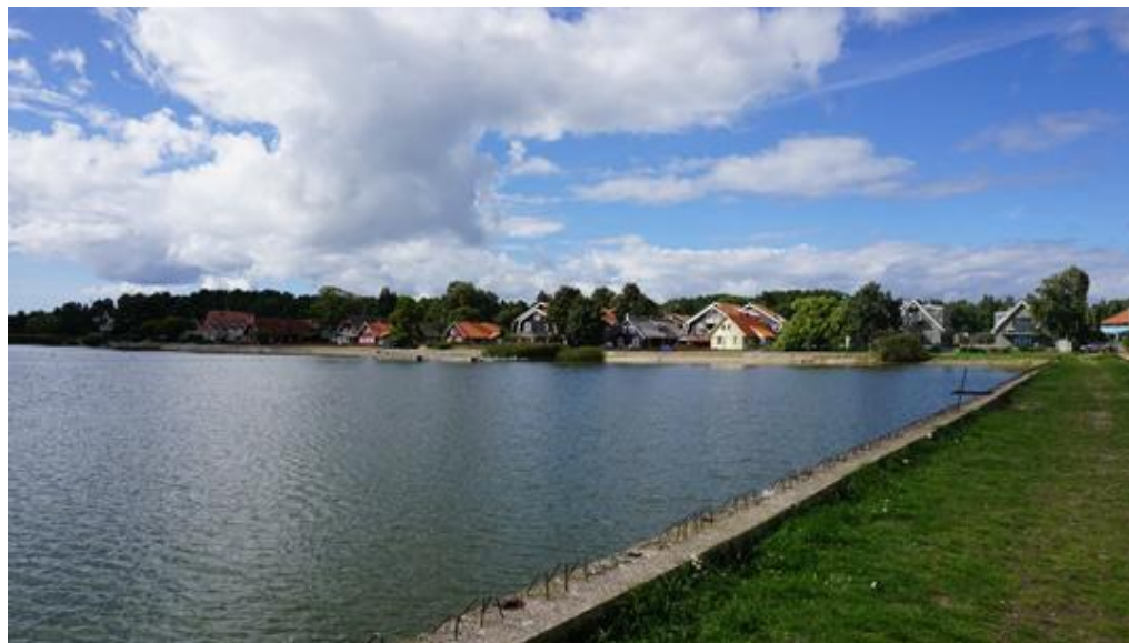
2021 metai, vasara