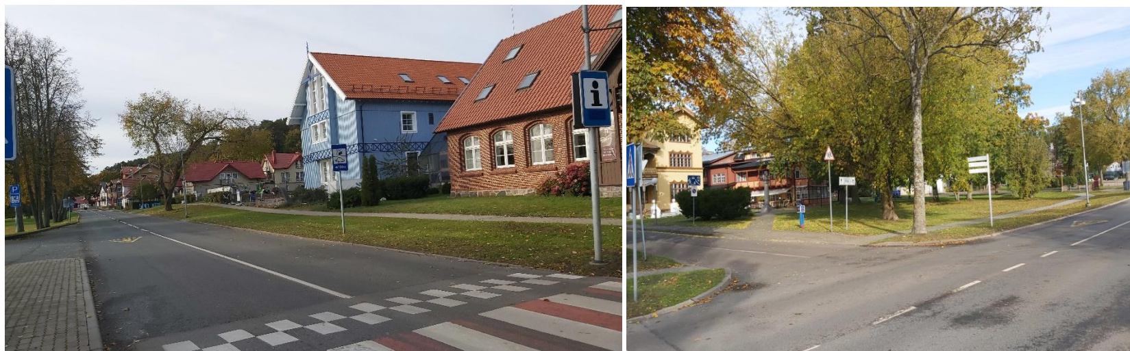
2023 metai, ruduo