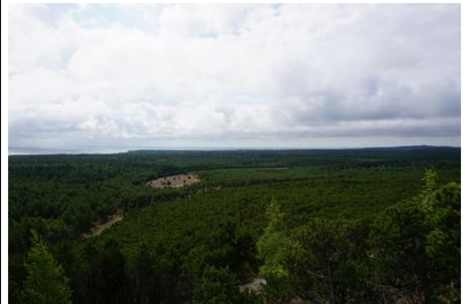
2015 metai, vasara