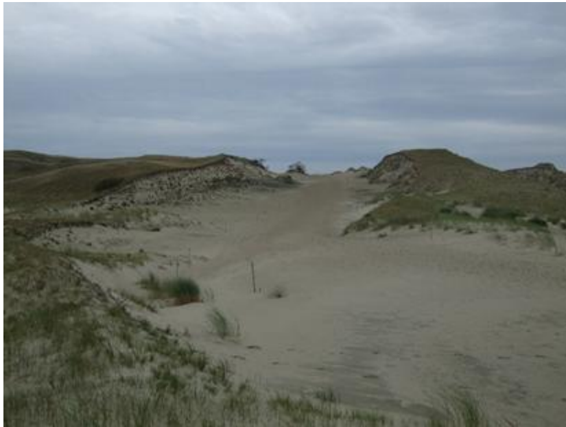
2012 metai, spalīs