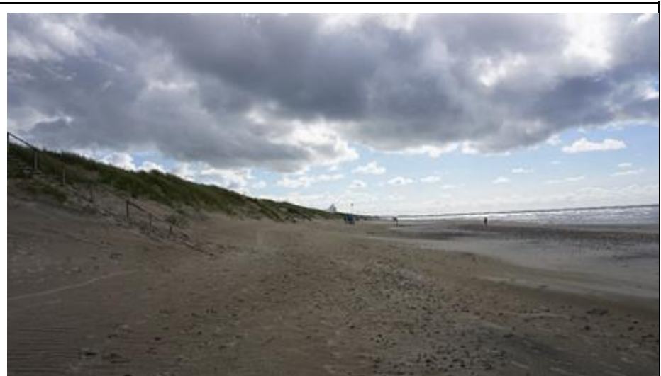
2021 metai, vasara