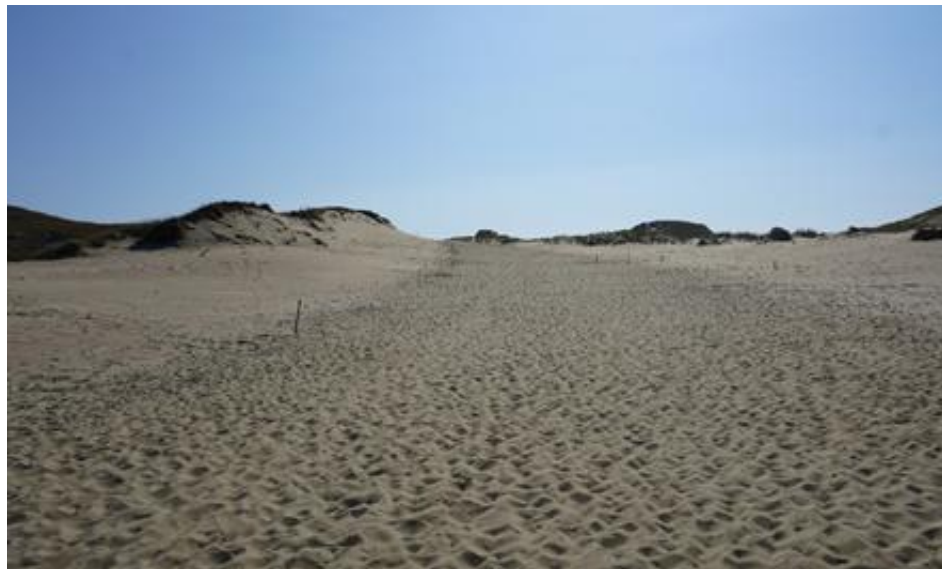
2016 metai, pavasaris