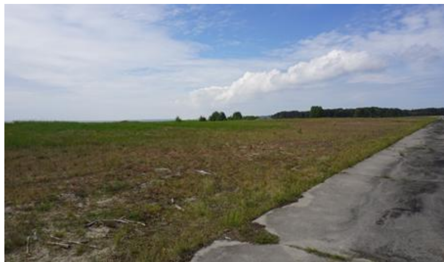
2017 metai, vasara