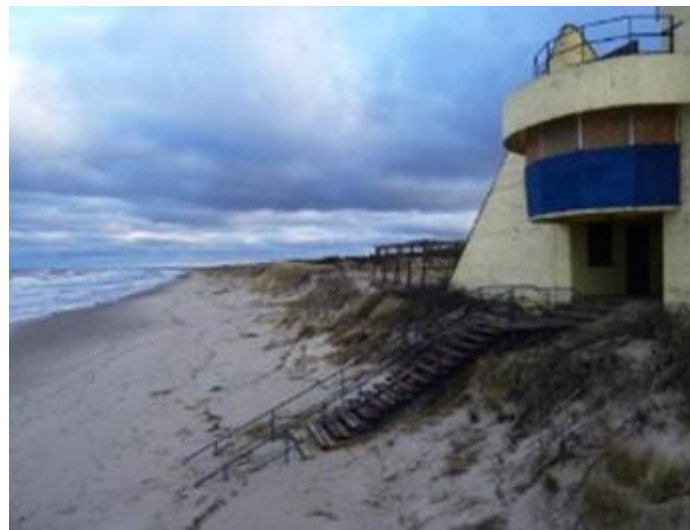
2015 metų sausio mėnesį po "Felikso" audros