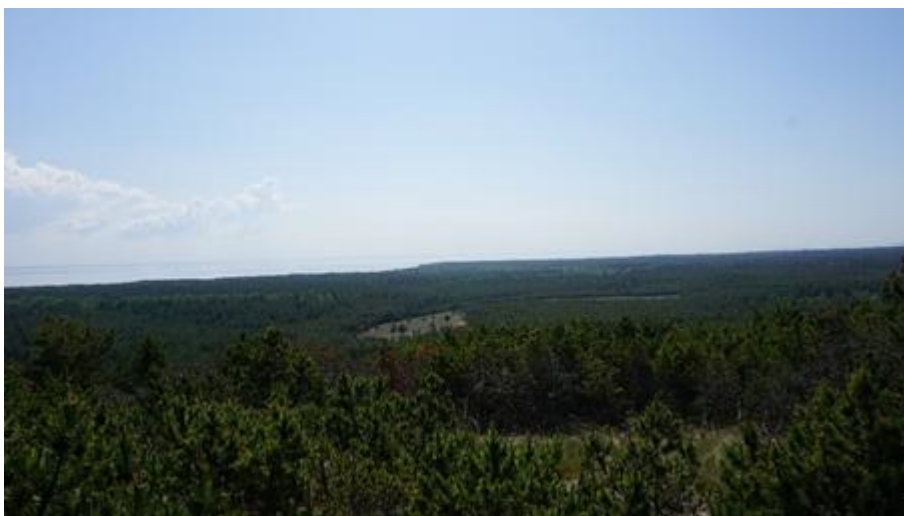
2016 metai, pavasaris