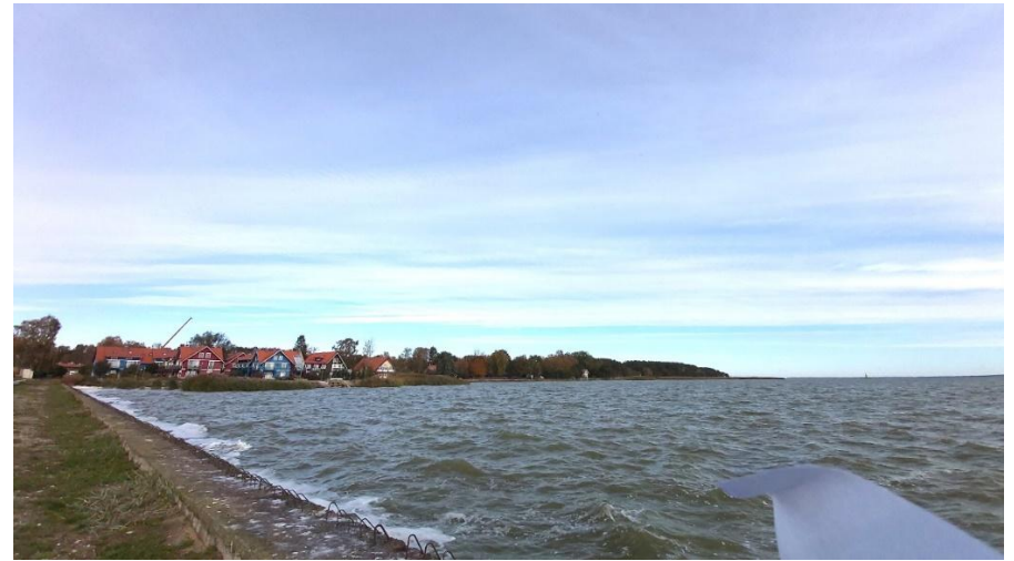
2023 metai, ruduo