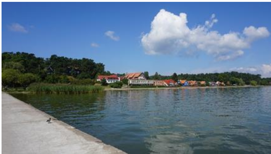
2020 metai, vasara