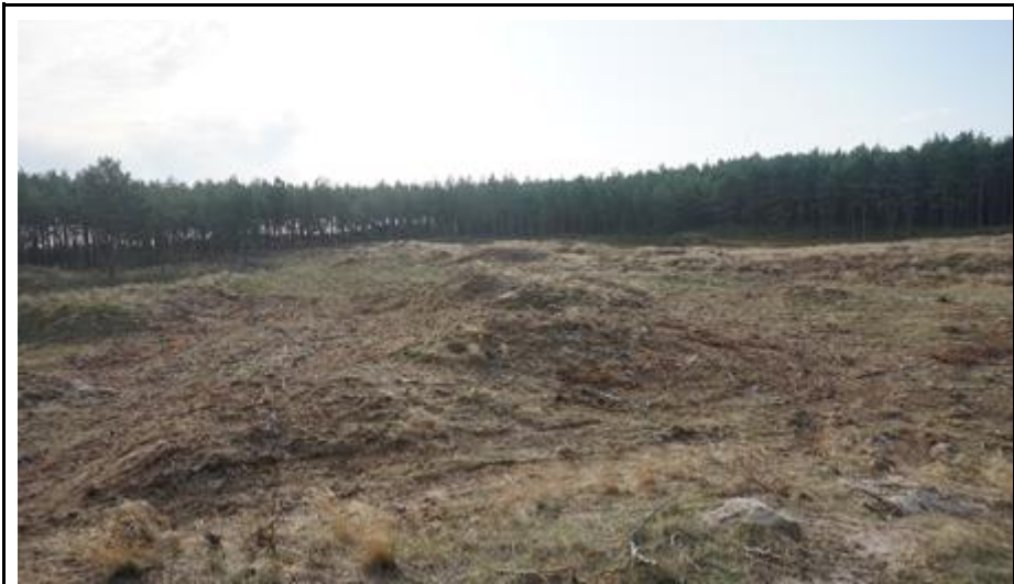
2019 metai, vasara