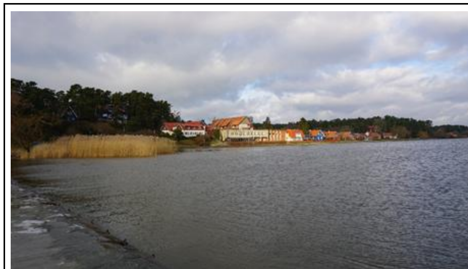
2016 metai, ruduo