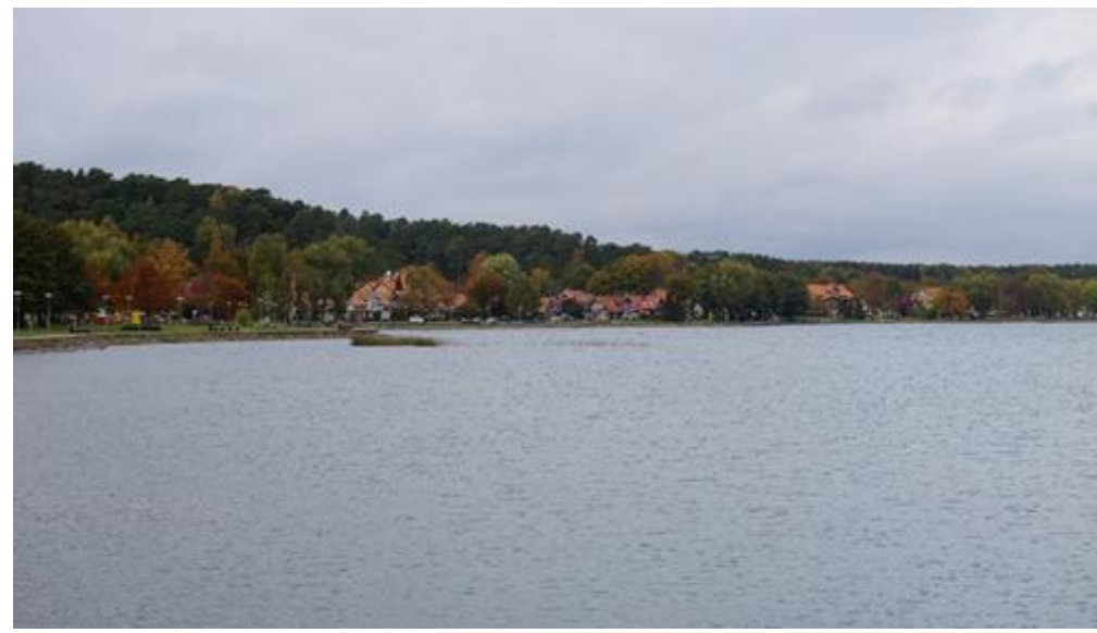
2021 metai, ruduo