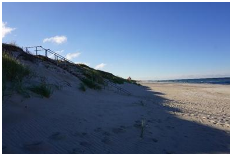
2015 metai, spalio