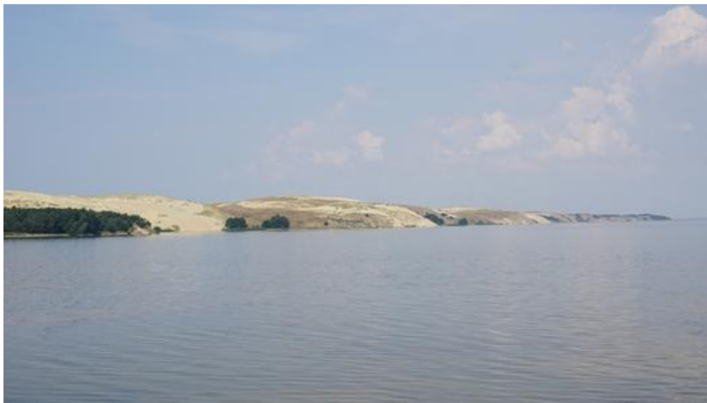
2021 metai, vasara