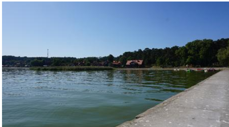
2019 metai, vasara