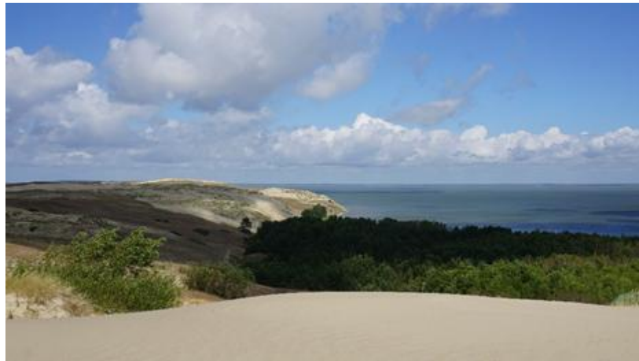
2019 metai, vasara