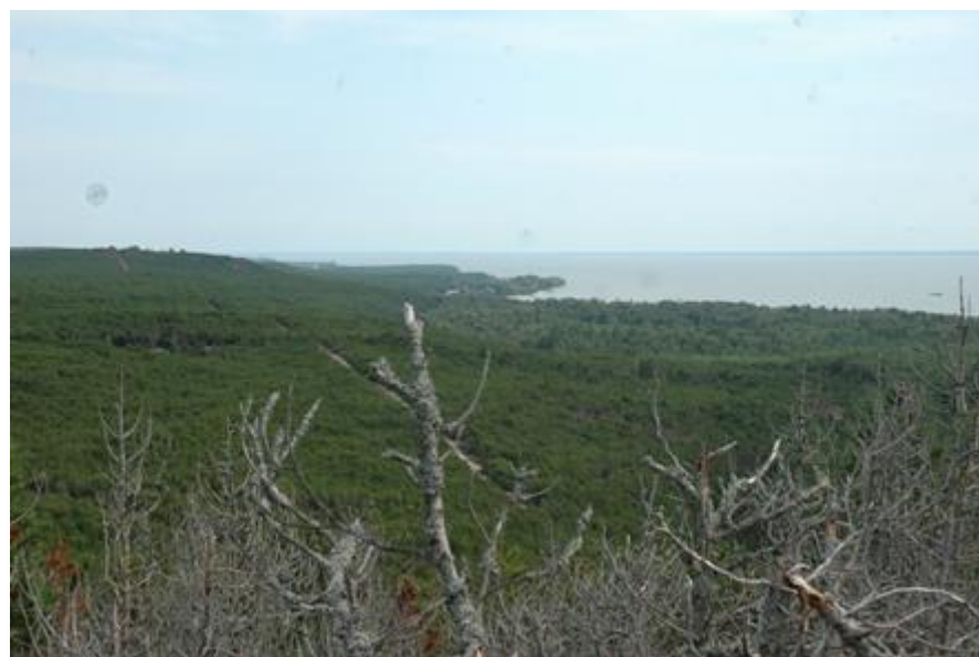
2007 metai, vasara