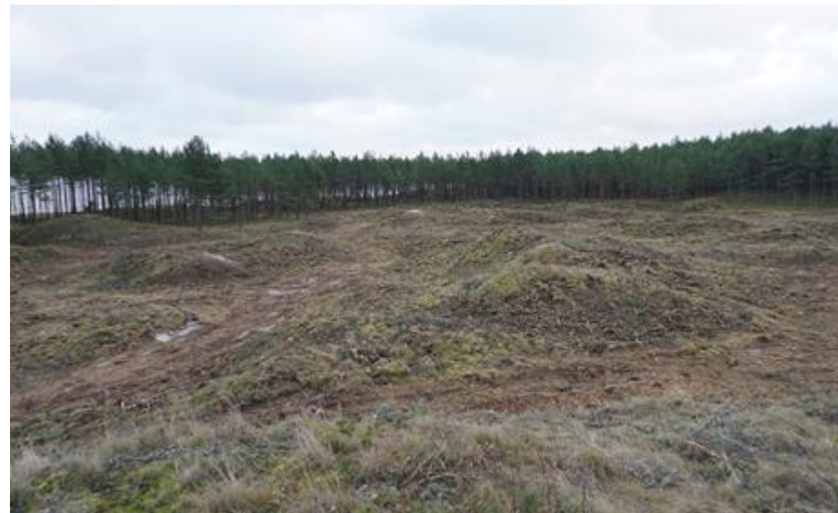
2016 metai, ruduo