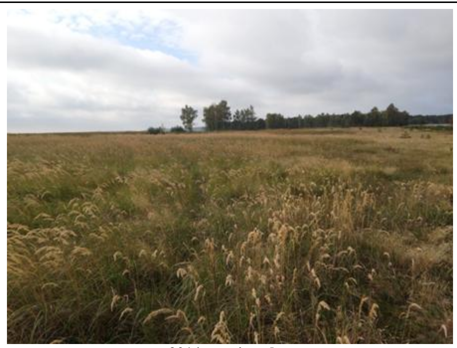
2014 metai, ruduo