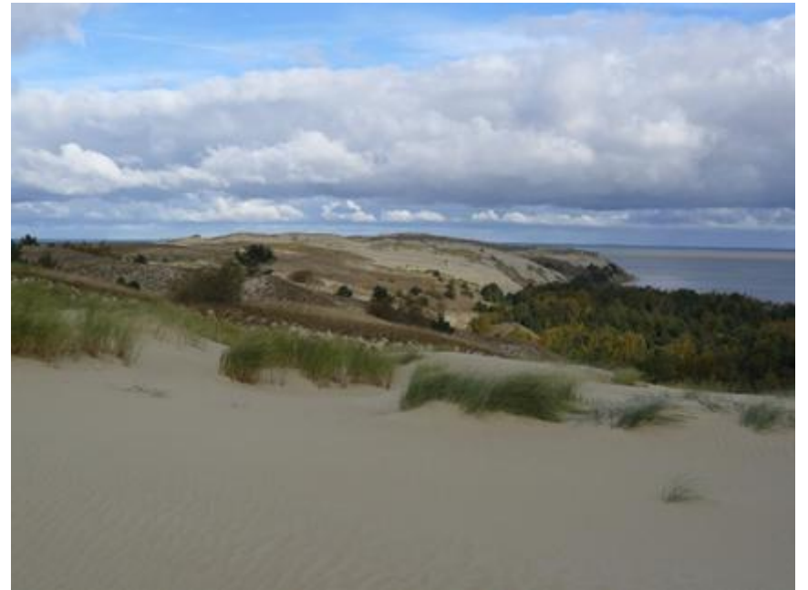
2010 metai, ruduo