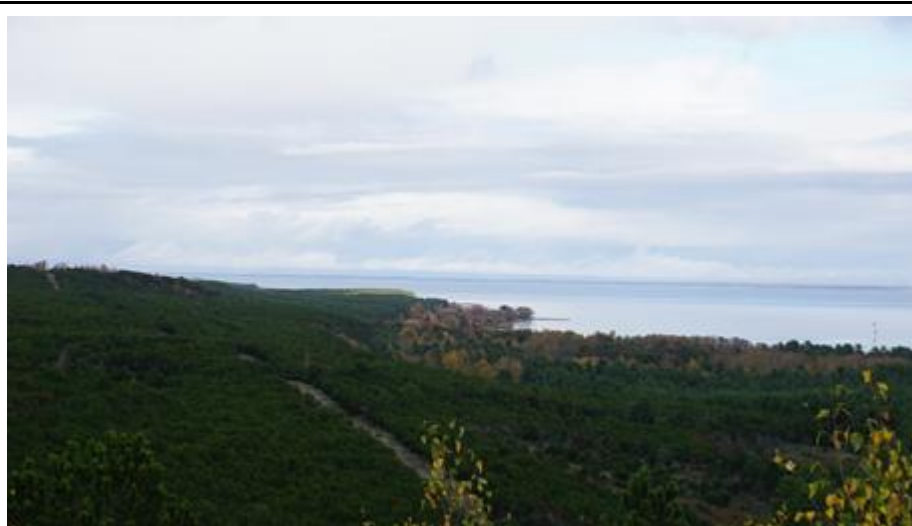
2019 metai, ruduo