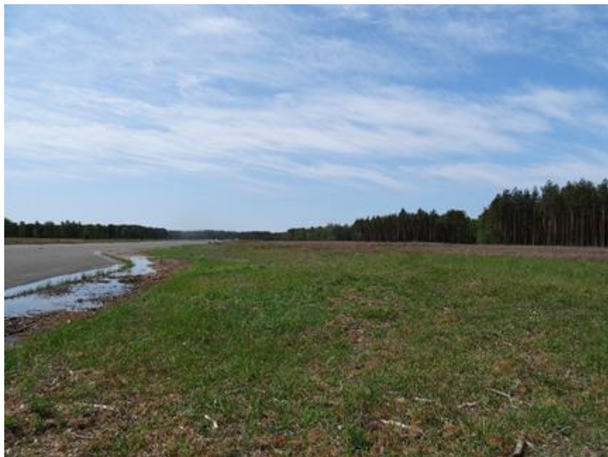
2015 metai, pavasaris