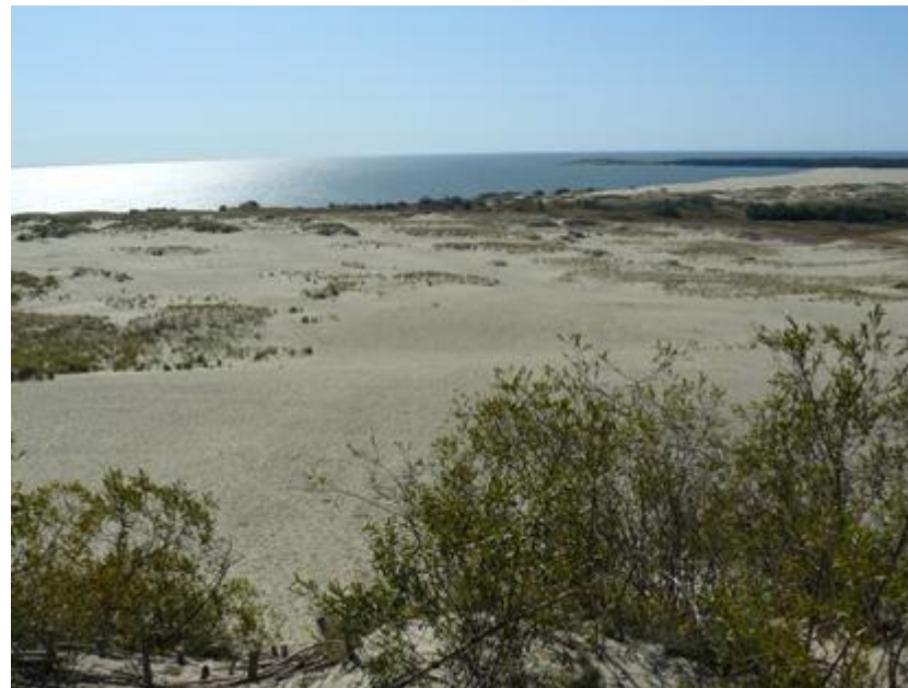
2009 metai, vasara