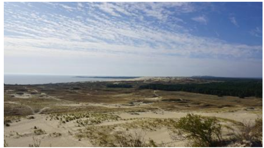
2020 metai, ruduo