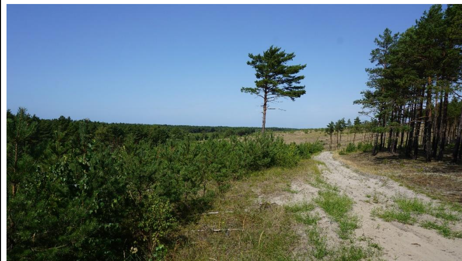
2023 metai, vasara