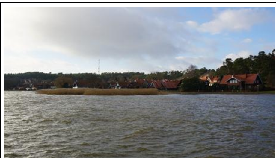
2016 metai, ruduo