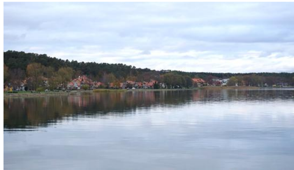
2019 metai, ruduo