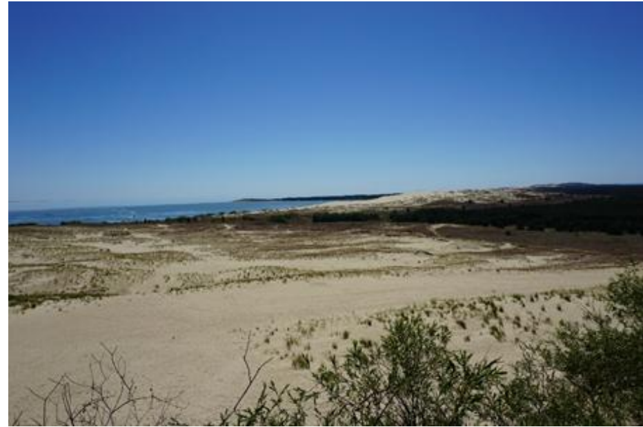
2015 metai, vasara