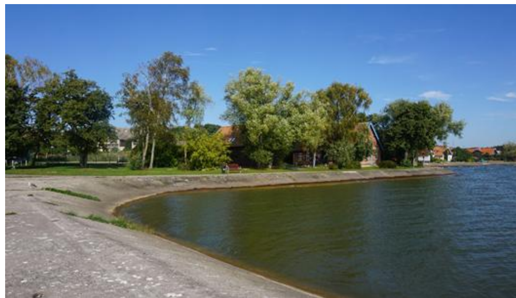
2020 metai, vasara