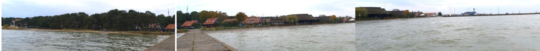
2023 metai, ruduo