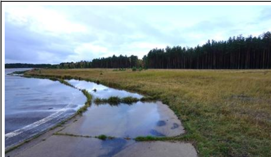
2019 metai, ruduo