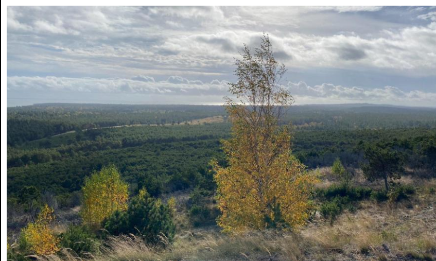
2022 metai, ruduo