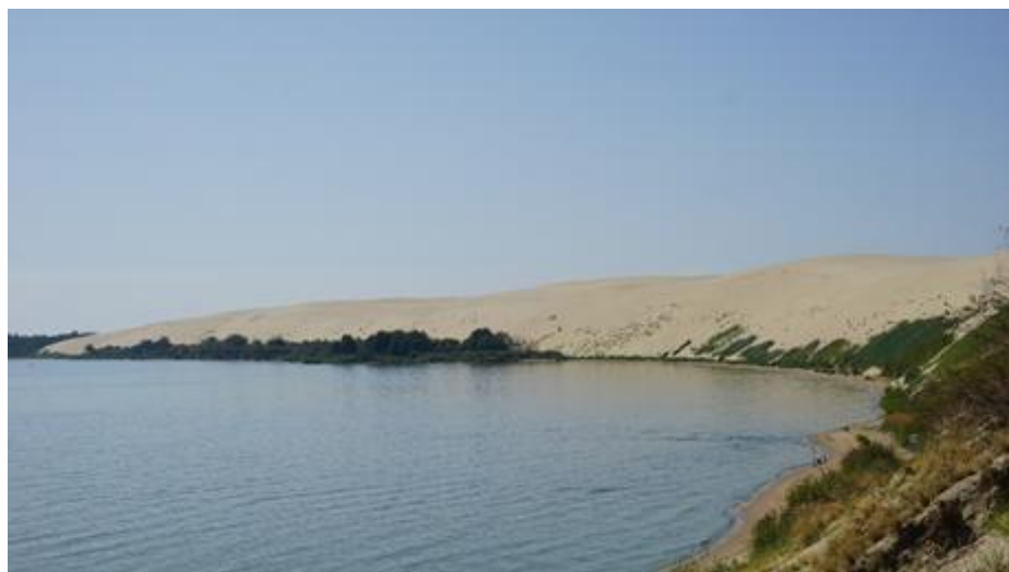
2019 metai, vasara