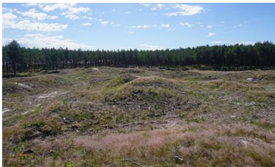
2017 metai, vasara