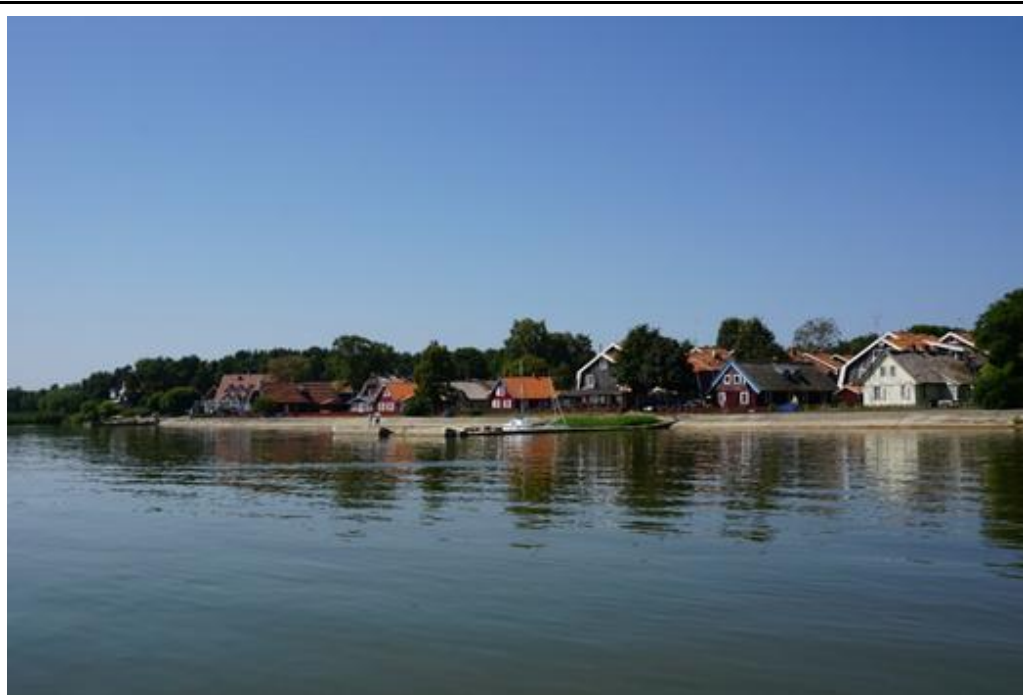
2015 metai, vasara