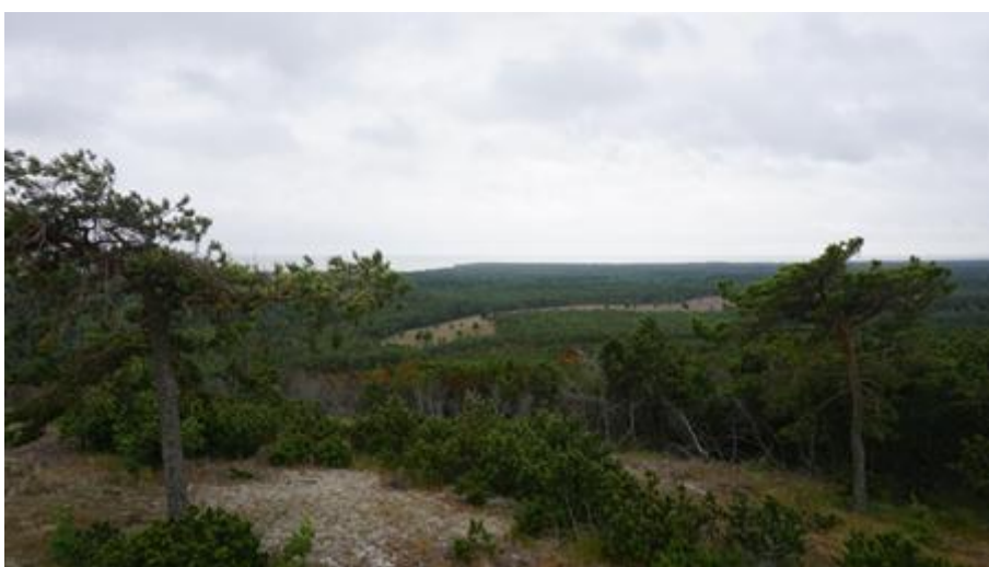
2017 metai, vasara