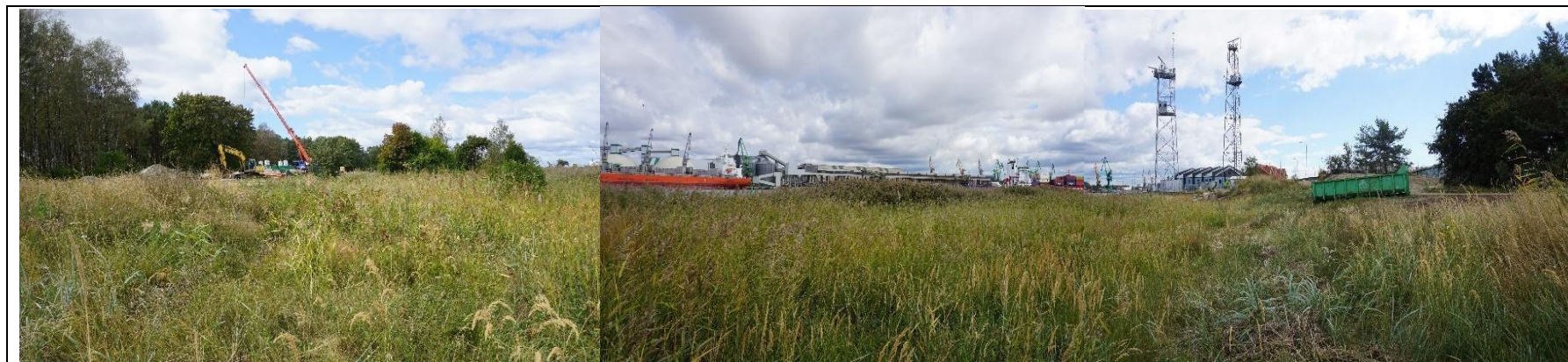
2022 metai, ruduo