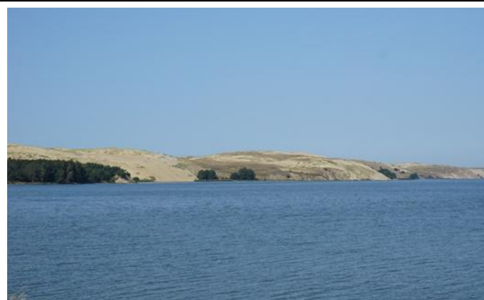
2020 metai, vasara