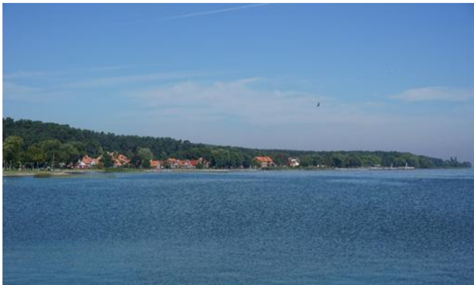
2015 metai, ruduo