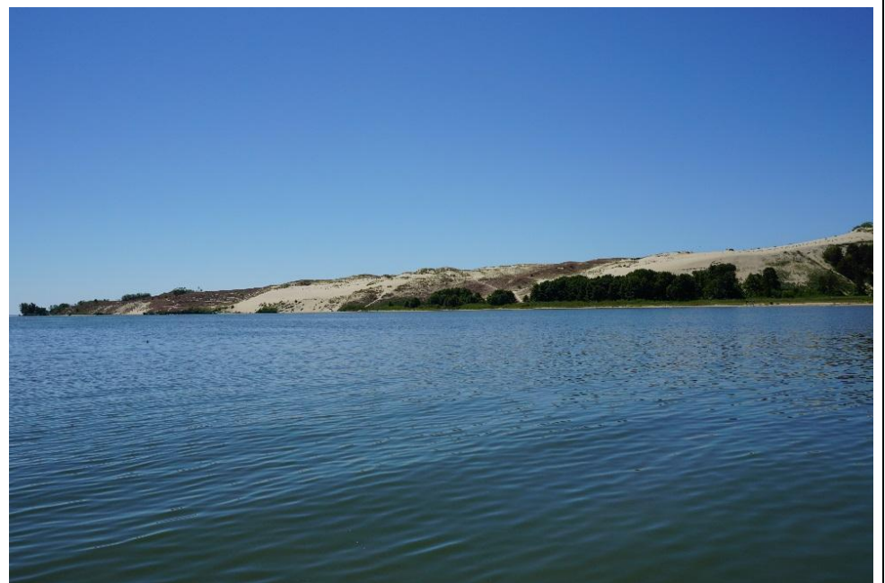
2015 metai, vasara