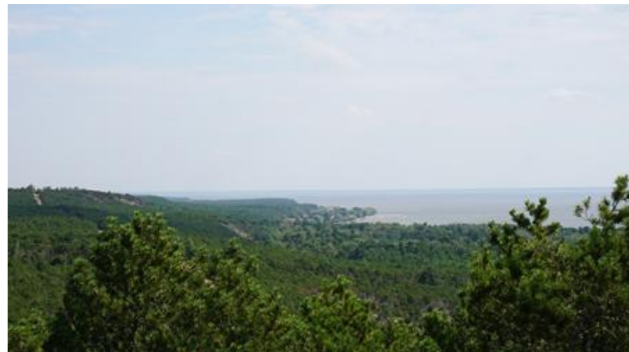
2018 metai, vasara