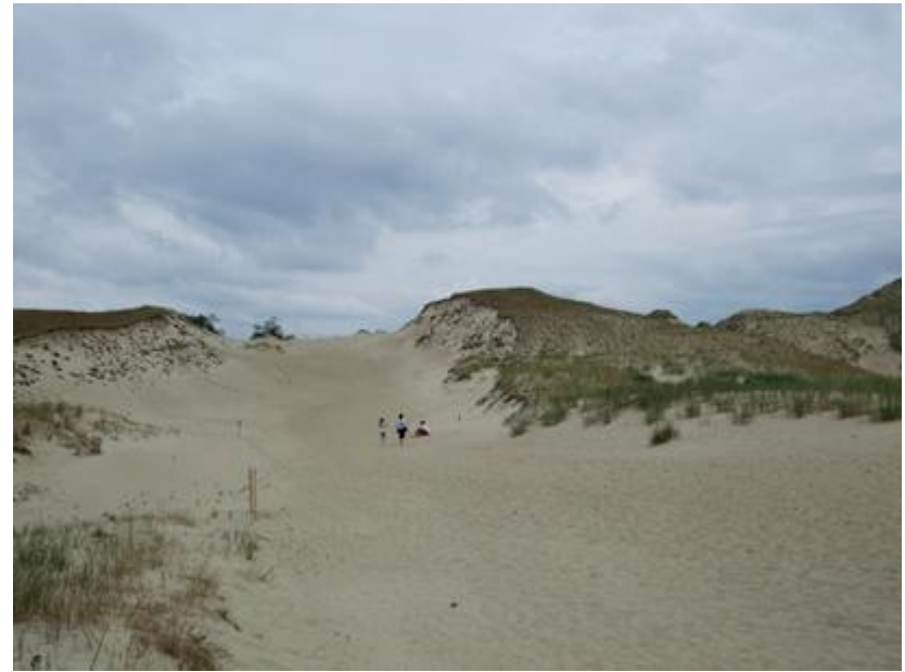
2013 metai, birželis