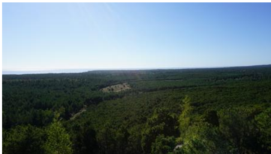
2016 metai, ruduo