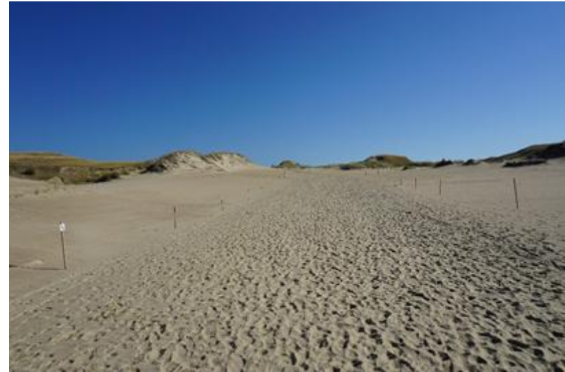
2015 metai, ruduo