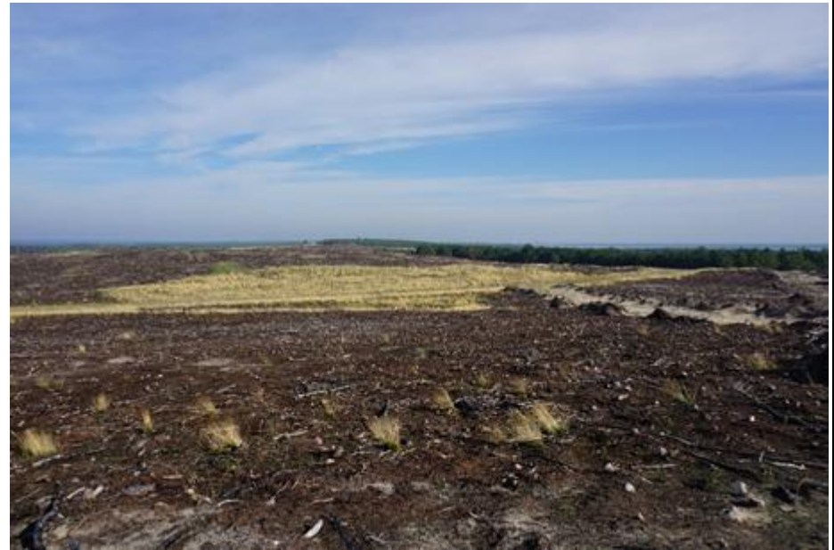
2015 metai, rudenio. Sutvarkyta gaisravietė