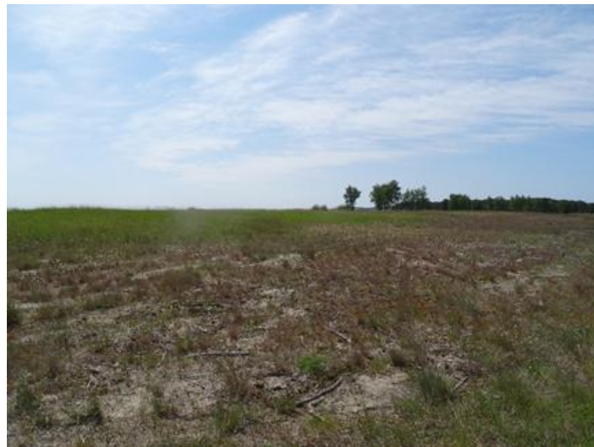
2015 metai, pavasaris