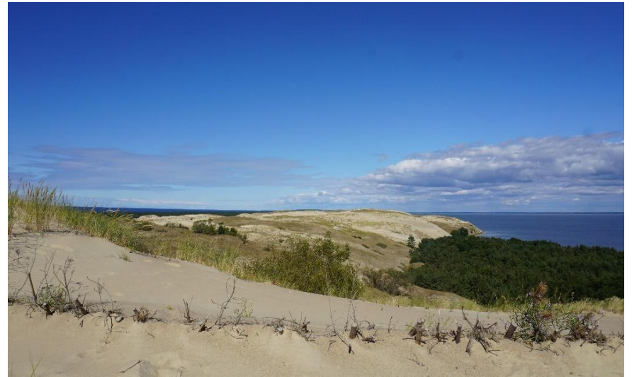
2022 metai, ruduo