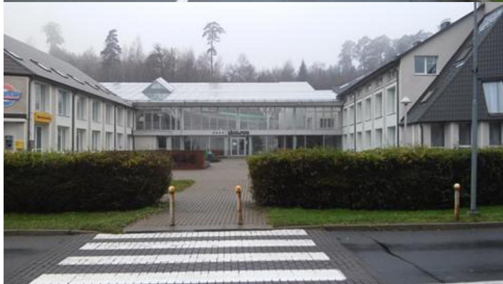
2014 m. Juodkrantės bažnyčia, ruduo