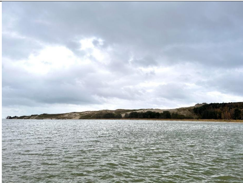
2022 metai, ruduo