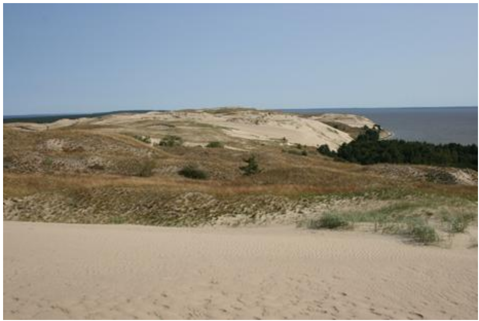
2007 metai, vasara