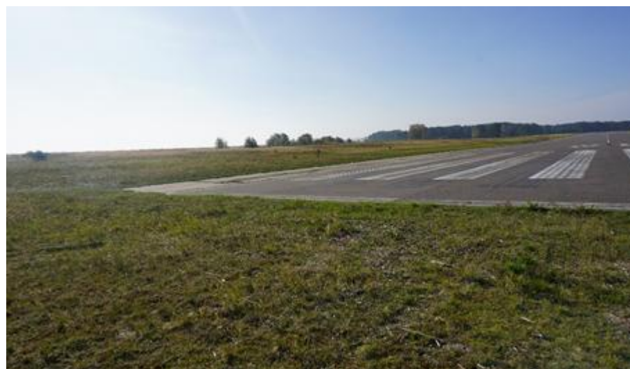
2018 metai, ruduo