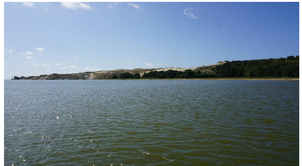
2023 metai, vasara