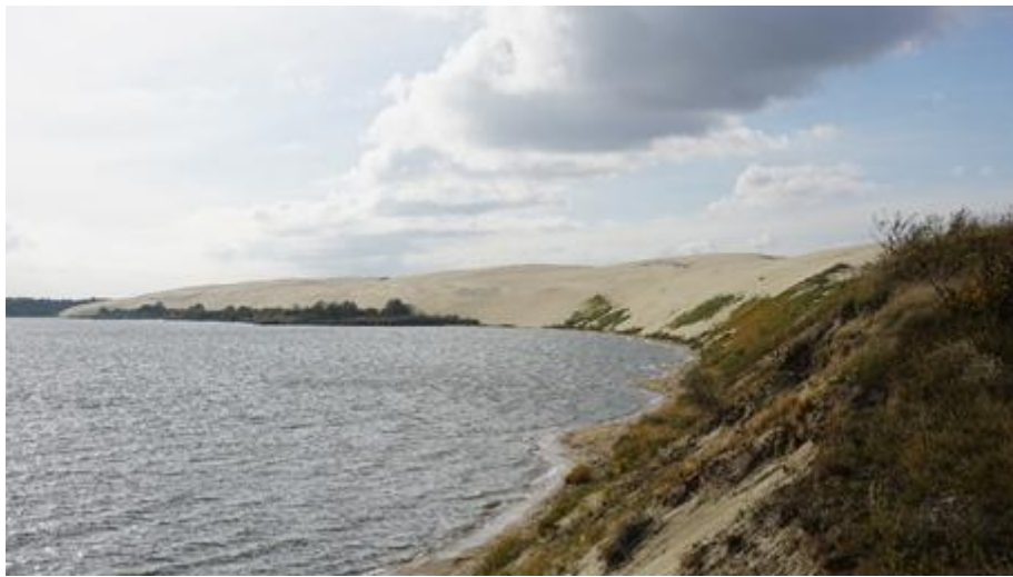
2021 metai, ruduo