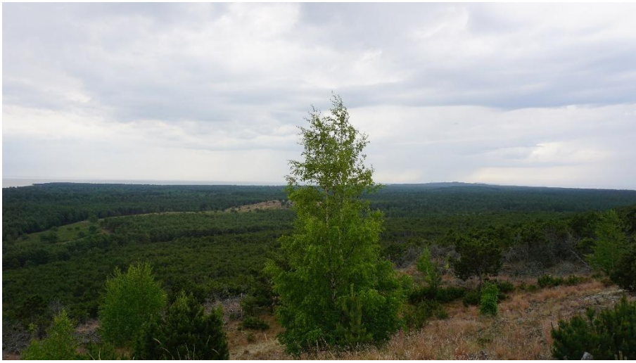
2023 metai, vasara