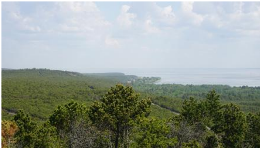
2016 metai, pavasaris