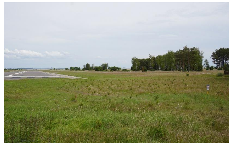
2022 metai, vasara