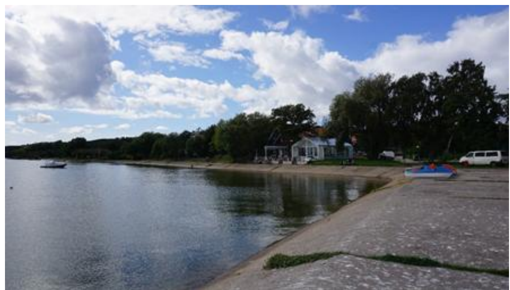
2021 metai, vasara