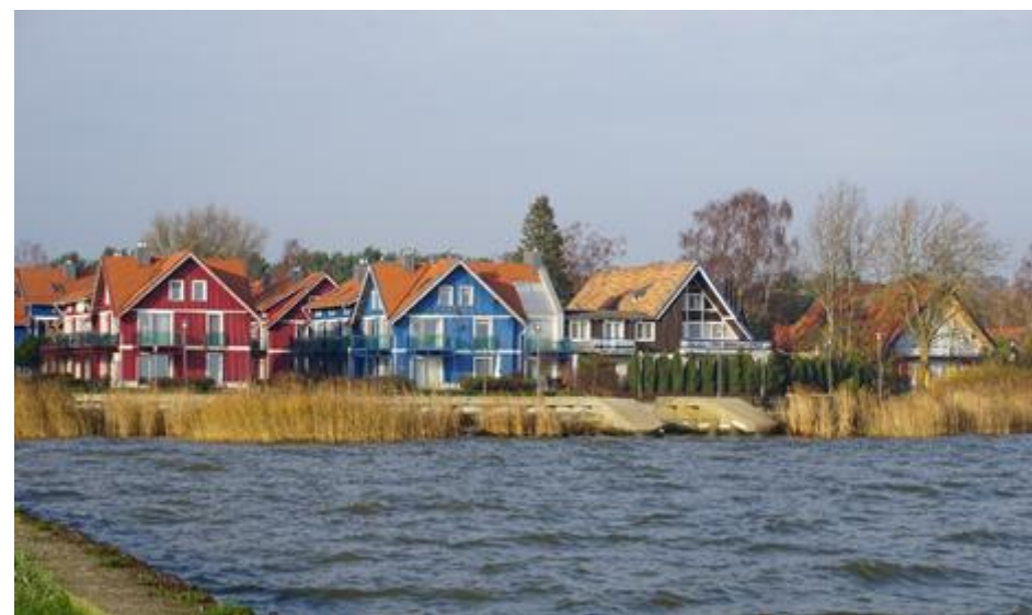
2019 metai, ruduo