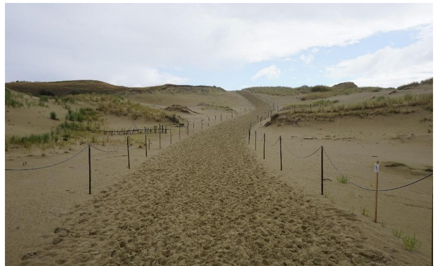
2022 metai, ruduo