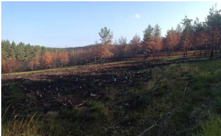
2014 metai, rudenio