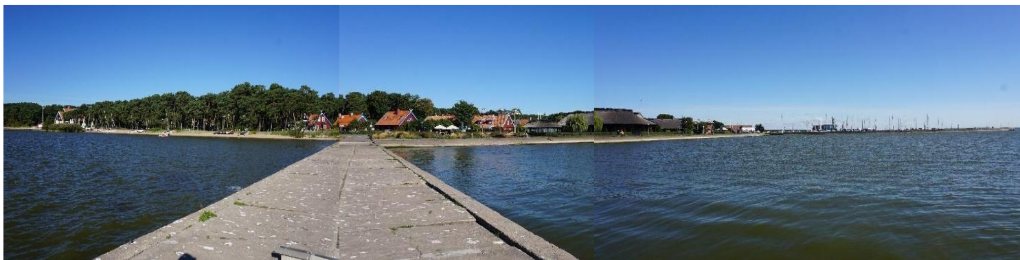
2022 metai, ruduo