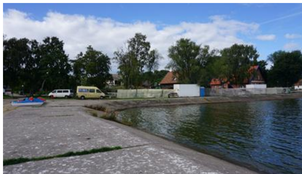
2021 metai, vasara