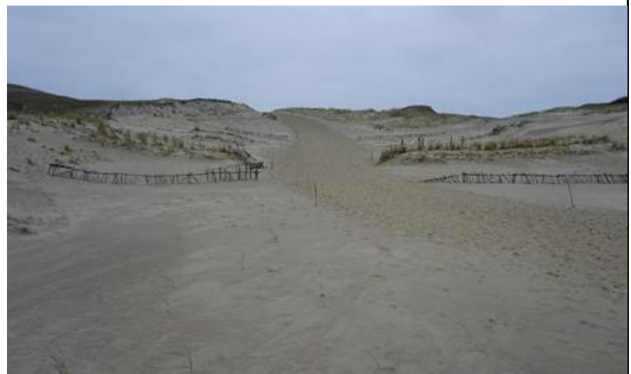
2020 metai, ruduo