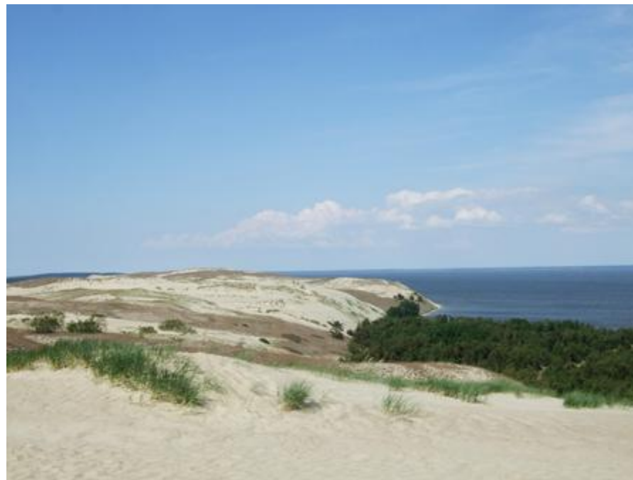
2012 metai, vasara