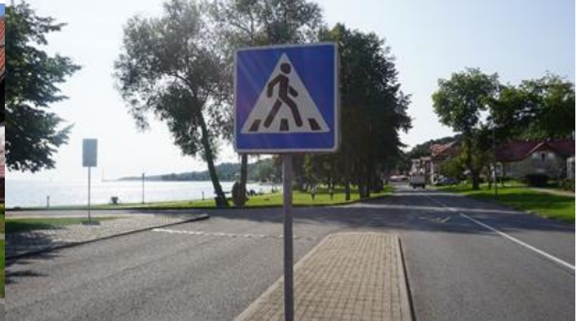
2020 m. Juodkrantė ties TIC, ruduo