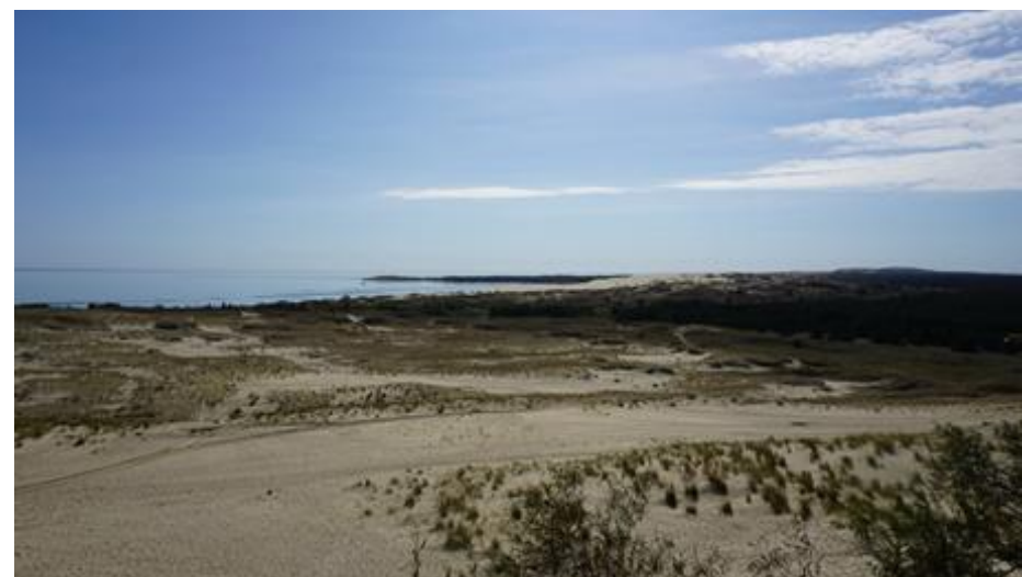
2016 metai, ruduo