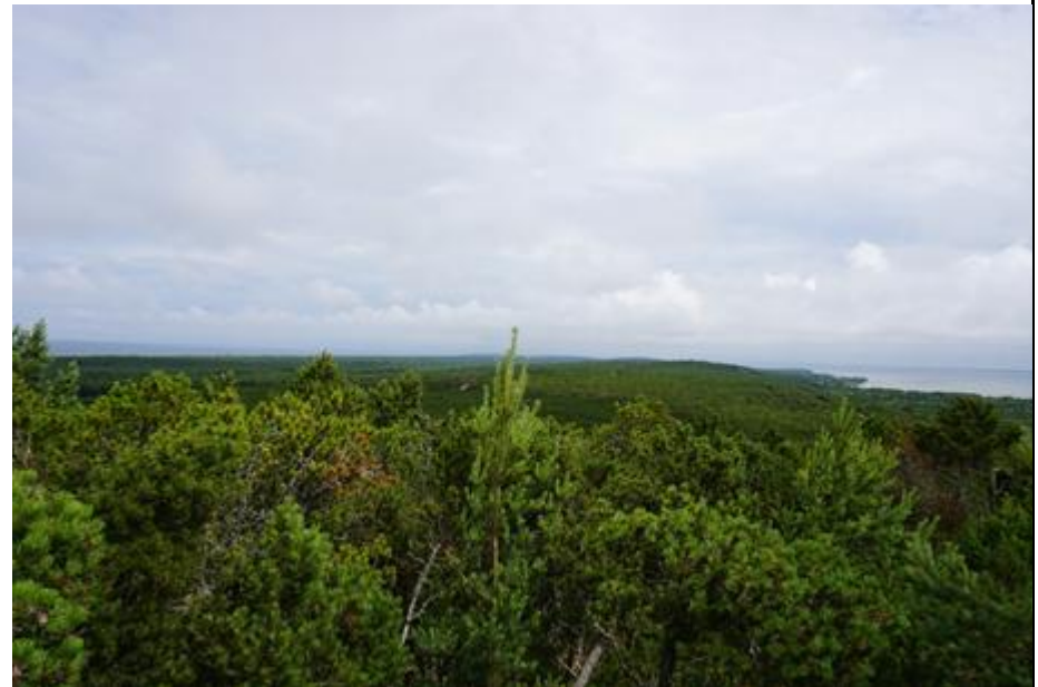
2015 metai, vasara