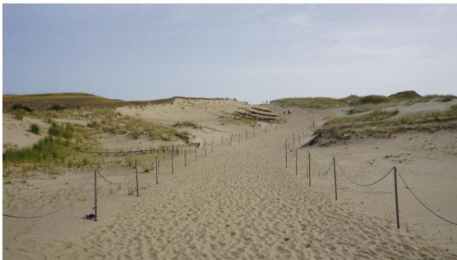
2023 metai, ruduo