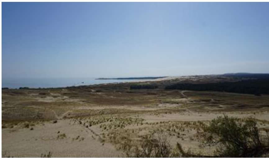
2019 metai, vasara