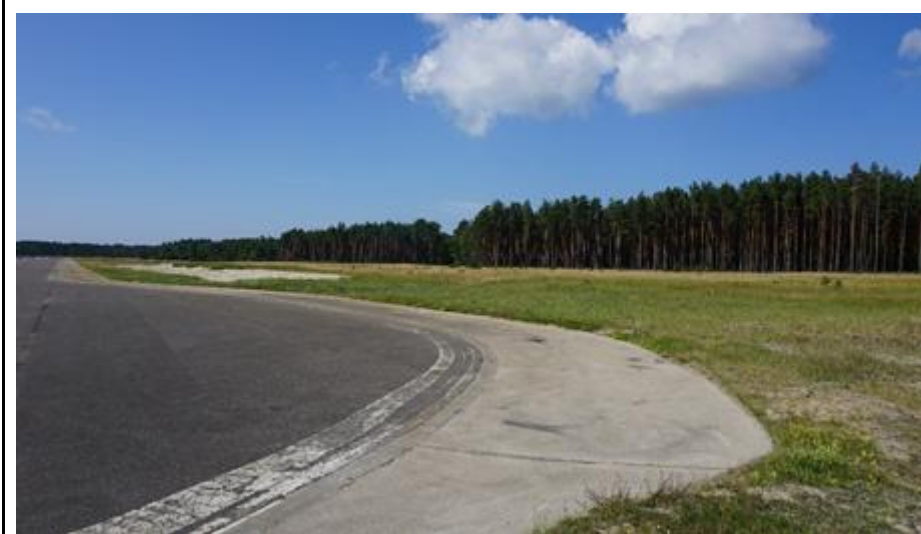
2020 metai, vasara