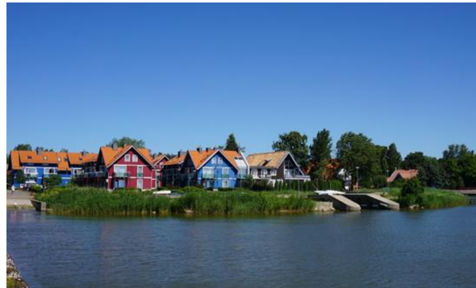
2017 metai, vasara