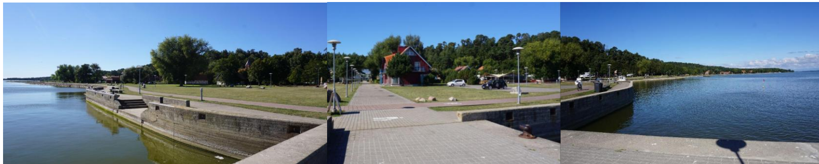
2022 metai, ruduo