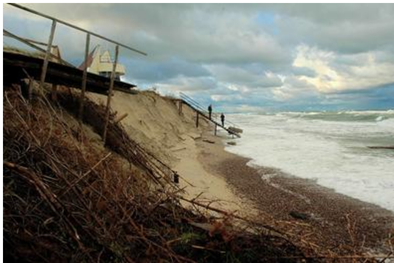
2009 metai, spalio