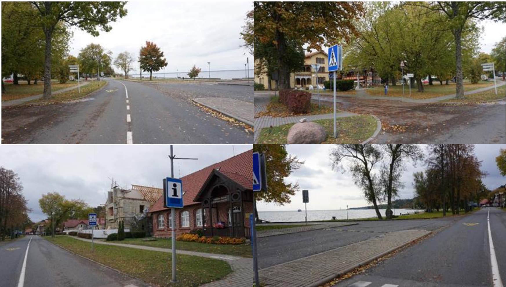
2021 m. Juodkrantė ties TIC, ruduo