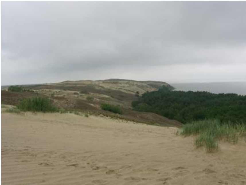
2014 metai, vasara