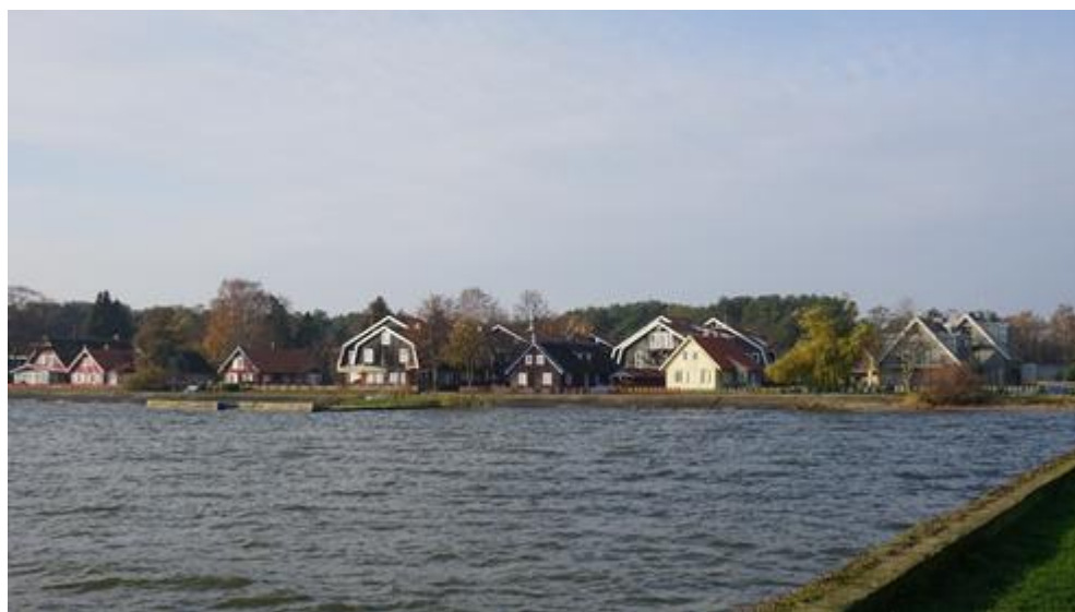
2019 metai, ruduo