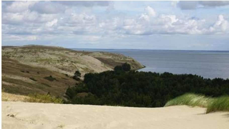
2018 metai, vasara