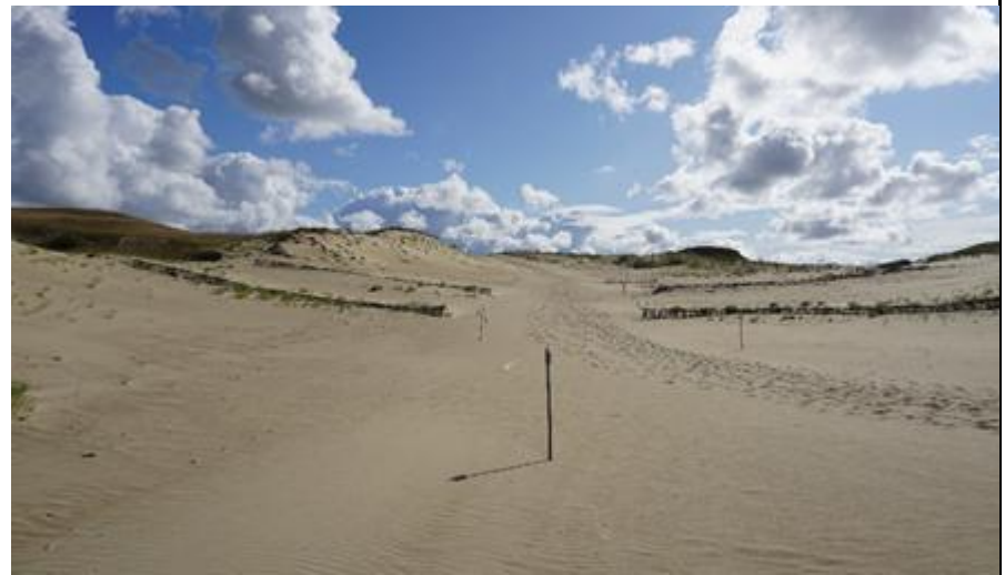
2018 metai, vasara