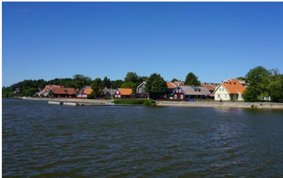
2017 metai, vasara