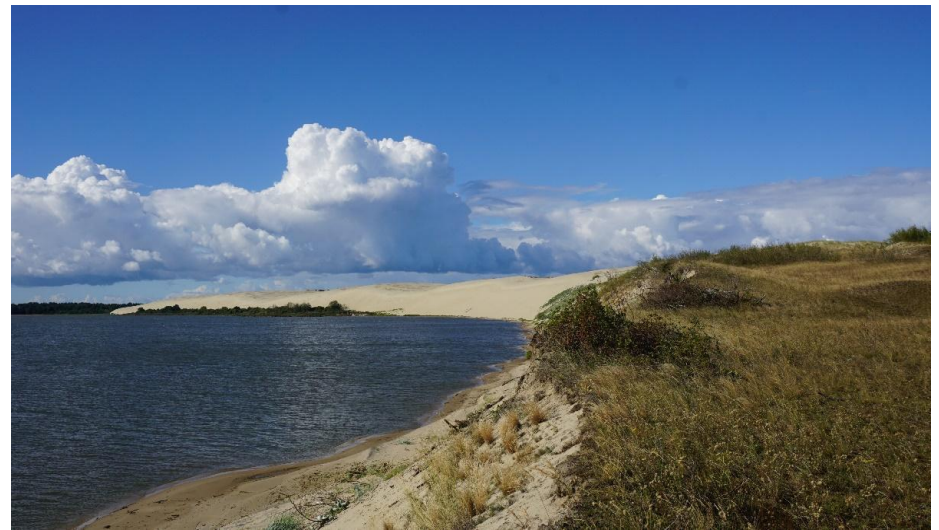
2022 metai, ruduo