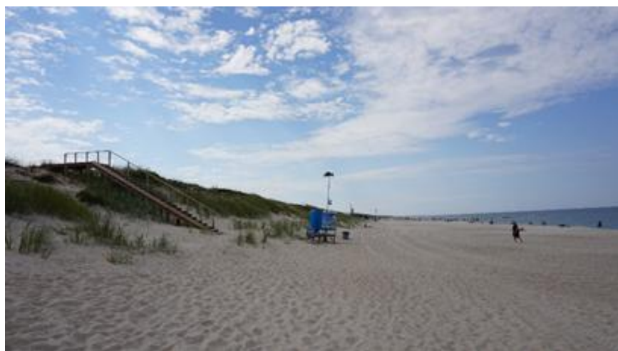
2018 metai, vasara