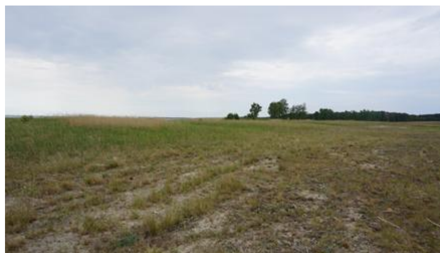
2016 metai, pavasaris