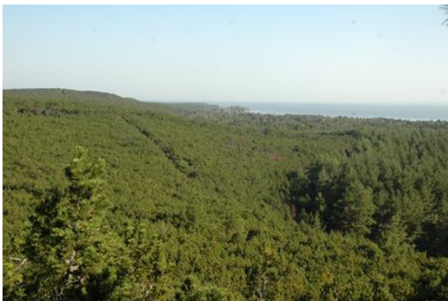
2006 metai, ruduo

kopos viršūnė įrengti laiptai, bei apžvalgos aikštelė ant kopos viršūnės lankytojams, pagal „Pėsčiųjų tako nuo Preilos gatvės iki Preilos kopos supaprastintas statybos projektas“ Nr. KNNP.17-1 projektą, tačiau žvelgiant nuo Vecėkrugo apžvalgos, aikštelės nesimato 2023 metais pokyčių nebuvo fiksuota