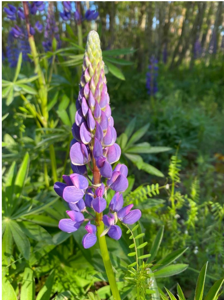
1 pav. Gausialapis lubinas

Gausialapis lubinas ( Lupinus polyphyllus Lindl.) yra daugiametis pupinių ( Fabaceae ) šeimos žolinis augalas, paprastai (40) 70—100 (150) cm aukščio (1 pav.).