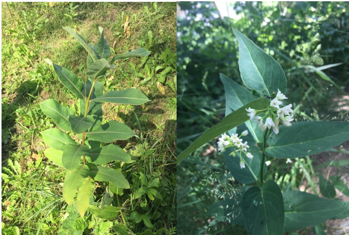
1 pav. Lietuvoje aptinkami stepukinių šeimos atstovai: sirinis klemalis (kairėje) ir šlakinė kregždūnė (dešinėje) (nuotr. Ž. Valiuškos)

Mažoji žiemė — gencijoniečių (Gentianales) eilės stepukinių (Apocynaceae) šeimos daugiametis visžalis augalas. Stepukinių šeimai priklauso ir Lietuvoje savaime paplitusi šlakinė kregždūnė ( Vincetoxicum hirundinaria Medik.) bei invazinis svetimžemis sirinis klemalis ( Asclepias syriaca L.) (1 pav.). Lotyniškas žiėmės ganties pavadinimas Vinca kildinamas iš lotynų kalbos veiksmazodžio vincire , reiškiančio „surišti“, „sukaustyti“, kadangi suformuoja tankius sąžalynus, kurie kaip kilimas uždengia vietinius augalus.