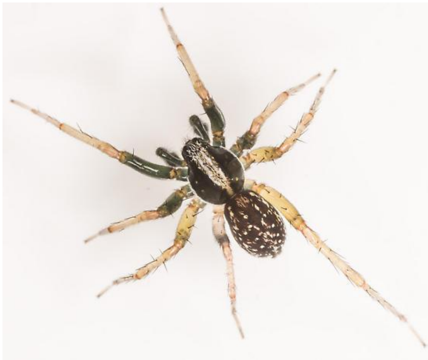
4 pav. Pirata montanus

buveinėmis (Bultman, DeWitt, 2007). Nors bendras rūšių skaičius natūraliose ir paveiktose buveinėse nesiskyrė, (abejose aptikta po 13 vorų rūšių), mažosios žiemos paveiktose miško buveinėse buvo aptiktos 6 nebūdingos vorų rūšys, o 6 rūšys, aptinkamos natūraliose miško buveinėse, čia buvo nebeaptiktos. Įdomu, kad ženkliai skyrėsi ir naujų (nebūdingų) 6 vorų rūšių individų gausumas - penkios iš šešių naujų rūšių buvo gana retos, tačiau viena, Pirata montanus , buvo labai gausi ir sudarė daugiau nei 70 % mažosios žiemos paveiktoje miško paklotėje surinktų individų (4 pav.). Panašu, kad mažosios žiemos invazija atvėrė šiam vorui galimybę įsikurti jam nebūdingoje aplinkoje.