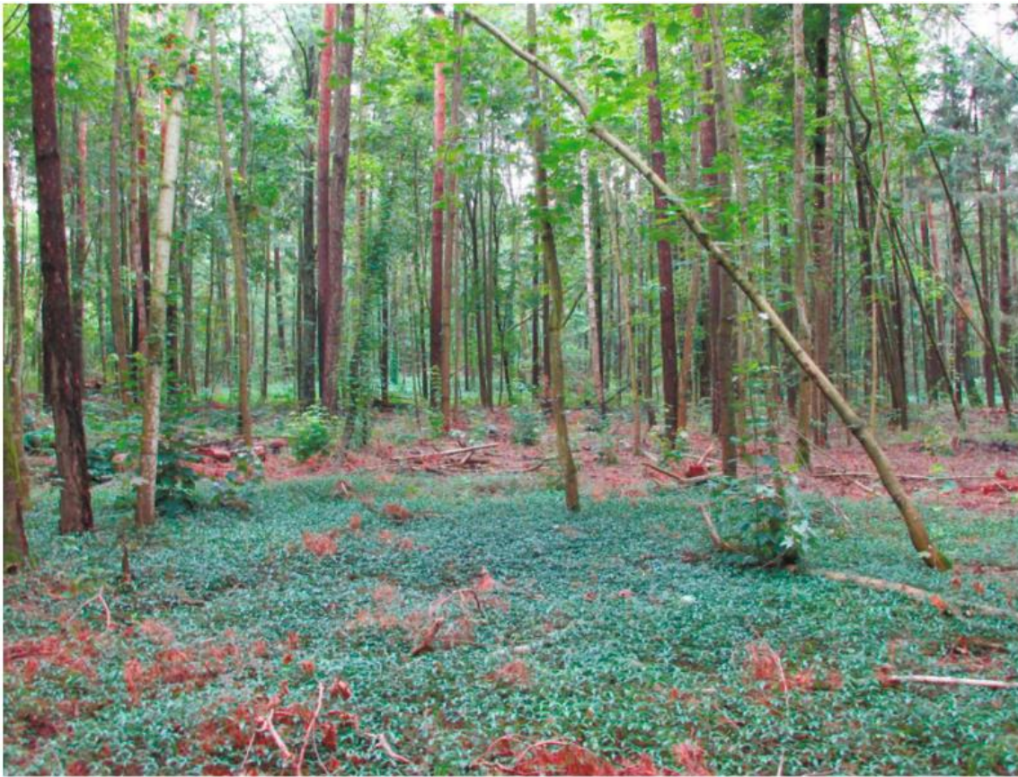
3 pav. Mažosios žiemos invazijos paveikta miško bendrija